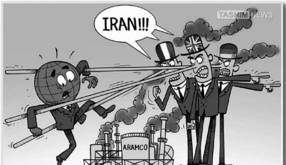
بیانیه اخیر سه کشور اروپایی در خصوص آرامکو که علیه ایران صادر شده است را می توان اشتباه استراتژیک اروپایی ها در شرایط فعلی عنوان کرد. / کاریکاتور: تسنیم

رقابت های فوتبال کارکنان دولت و اصناف شهرستان