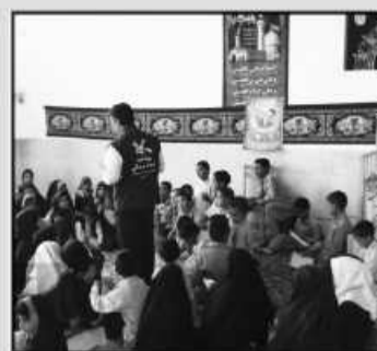
در دومین روز از هفته ملی کودک، بچه‌های شهرک عشایری مهر دشت از توابع شهر درج، شهرستان سربیشه با «بیک امید» خراسان