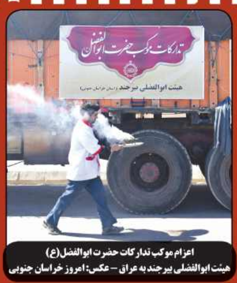
اعزام موکب تدارکات حضرت ابوالفضل (ع) هیئت ابوالفضل بیرجند به عراق - عکس: امروز خراسان جنوبی