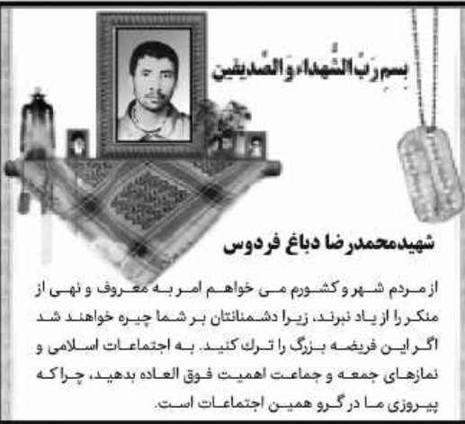
بِسْمِ رَبِّ الشَّهَادَةِ وَالصَّادِقِينَ