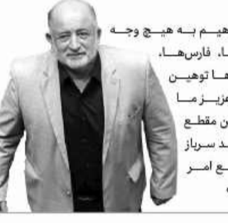
نادر قاضی پور نماینده مردم ارومیه در مجلس شورای اسلامی

گفته می‌شود طبق اعلام مرکز آمار در سال ۹۷ حدود ۳۱ درصد از خانوارهای کشور در خانه‌های با زیربنای ۴۰ متر و کمتر زندگی کرده‌اند. این مقدار برای دهک اول معادل ۱۲/۸ درصد بوده است. همچنین سطح زیربنای محل سکونت حدود ۲۴/۲ درصد خانوارهای دهک اول، کمتر از ۵۰ متر بوده است، یعنی حدود یک چهارم خانوارهای فقیرترین دهک جامعه، در خانه‌هایی با زیربنای کمتر از ۵۰ متر سکونت داشته‌اند. در حالی که این عدد برای دهک پنجم در حدود ۸/۶ درصد گزارش شده است.