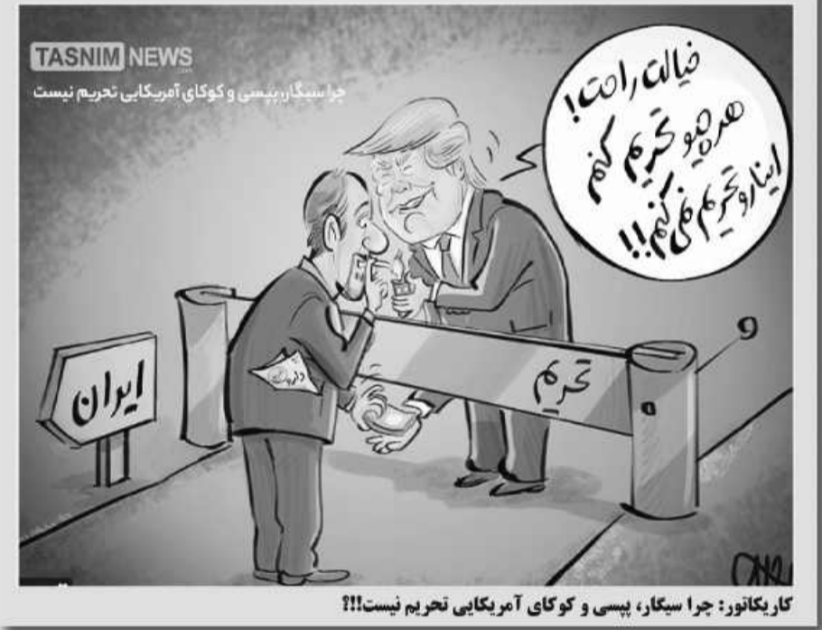
کارکنان: چرا سیگار، پسی و کوکای آمریکایی تحریم نیست!!!

رئیس هیئت فوتبال خراسان جنوبی گفت: رقابت‌های فوتسال در رده پیشکسوتان که با حضور هفت تیم و بصورت دوره‌ای از دوم مهرماه سال جاری در شهر اسدیه شروع شده بود با قهرمانی تیم خونیکسار با ۱۸ امتیاز به پایان رسید. قهوه چی گفت: تیم طبلس مسینا با ۱۵ امتیاز مقام دوم و تیم استخرمیتاق اسدیه با ۱۲ امتیاز مقام سوم را از آن خود کردند.