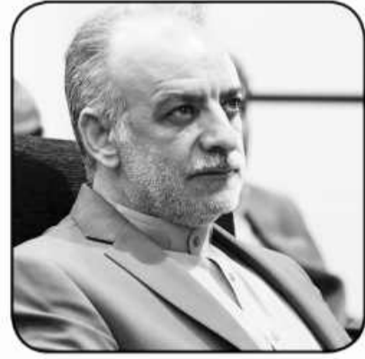
عنوان اساس و پایه کار نظام تعلیم و تربیت پیش بینی شده؛ لذا اجرای دقیق و با برنامه همه مفاد این سند ضروری است.

مسئله آن است که در آن توجه به زیرساختها از اهمیت ویژه ای برخوردار است. مدیرکل آموزش و پرورش خراسان جنوبی، استقلال خواهی، اسلام خواهی و ولایت پذیری را سه عامل خشم مستکبرین به سرکردگی شیطان بزرگ از ملت ایران دانست و ابراز داشت: تحقق اهداف سند تحول و تربیت دانش آموزانی در تراز جمهوری اسلامی و اسلام ناب محمدی از عوامل مهم و موثر ترویج فرهنگ پدافند غیر عامل در مدارس و اقشار مختلف جامعه ی استان است. وی، اتحاد، همدلی و حرکت بر صراط مستقیم ولایت را لازمه حفظ اقتدار ایران اسلامی و پیروزی در برابر توطئه های دشمنان داخلی و خارجی دانست و افزود: پدافند غیر عامل در حوزه آموزش و پرورش و در سند تحول به