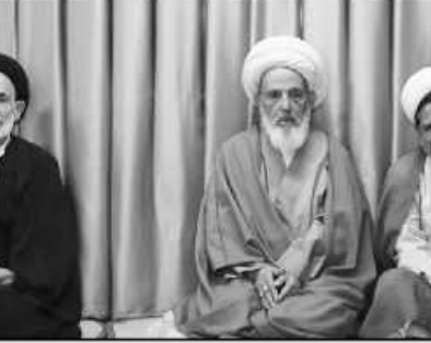
بی عدالتی که از من نوعی و دیگران دیده می شود عده ای فقیر و عده دیگر ثروتمند خواهند شد و در این شرایط جامعه نمی تواند اسلامی شود اما وقتی عدالت اجرا شود و در کنارش ارشاد باشد جامعه اسلامی و سپس تمدن اسلامی ایجاد می شود.

انسان را اگر انسان می داند و اخلاق و دین در این ایندولوژی معنی ندارد مگر منافع اقتصادی را تأمین کند، مکتب اهل بیت (ع) و با استقلال و آزادی که انقلاب اسلامی به ما داده، به دست آمده است. حجت الاسلام و المسلمین سید علیرضا عبادی در دیدار مسئولان دفاتر نهاد نمایندگی ولی فقیه در دانشگاه های خراسان جنوبی و مدیران حوزه های علمی بیرجند افزود: شرایط انقلاب اسلامی با همه کشورها متفاوت است چون به برکت انقلاب رشد علمی همه جانبه داریم و این رشد فوق تصور بیگانگان است. وی گفت: عده ای از بیت المال مسلمین پول می گیرند که سر کلاس درس علمی بدهند اما حرف های نامربوط می زنند و این به دلیل بی توجهی و نا آگاهی آنها است. نماینده ولی فقیه در خراسان جنوبی ادامه داد: تفکر لیبرال دموکراسی دشمن انسانیت است و هیچ بلایی بدتر از این تفکر و بیماری نیست چون مملکت توجیه هر امر را مسائل اقتصادی می داند و خود را هم به عنوان حیوان اقتصادی معرفی می کند. وی گفت: ما نتوانستیم ۴۰ سال، چهره کریه دشمن مکار را به مردم معرفی کنیم.