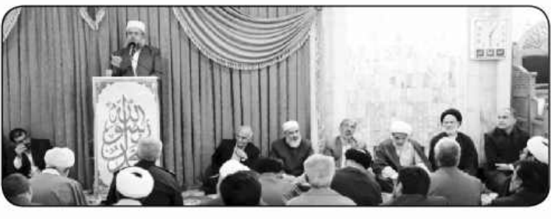
نماینده ولی فقیه در دیدار مسئولان دفاتر نهاد نمایندگی ولی فقیه در دانشگاه های خراسان جنوبی