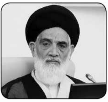
اقامه عدل، از مهم ترین اهداف دستگاه قضاست رئیس دیوان عالی کشور در جمع مردم قاین در مسجد جامع این شهر نیز گفت: اقامه عدل، از مهم ترین اهداف دستگاه قضاست.

وی با اشاره به معضل بی عدالتی در جامعه گفت: