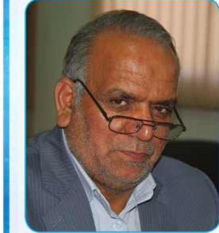
تومان در استان آغاز شده، اضافه کرد: اعتبارات ملی راه های استان افزایش چشمگیری داشت و از ۶۰ میلیارد تومان سال قبل به سه برابر معادل ۱۷۰ میلیارد تومان افزایش یافت. جعفری افزود: پروژه های ناتمام حوزه راه خراسان جنوبی به ۱۰۰۰ میلیارد تومان اعتبار نیاز دارد.