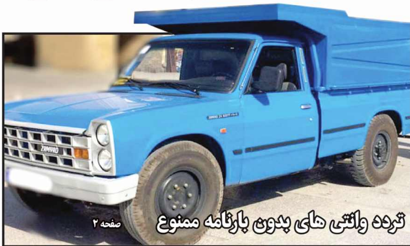
ترنده واگتی های بدون پارنامه ممنوع

وضعیت بازار کتاب در خراسان جنوبی خوب نیست