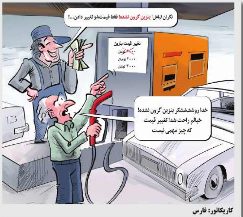
کار یکاتور: فارس