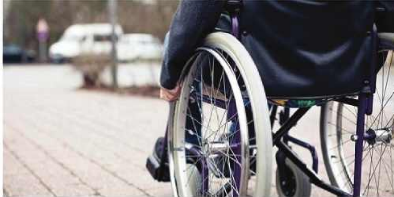
فرمانداری بیرجند مشغول به کار است و در مورد کاری که انجام می‌دهد می‌گوید منم سالی که استخدام شدم با مدرک فوق دیپلم بودم بعد مدرک لیسانس گرفتم و الان مدرک فوق لیسانس دارم.

۱۵ سال از تصویب قانون به کارگیری ۳ درصد معلولان در ادارات می‌گذرد، اما دستگاه‌های اجرایی همچنان از اجرای این قانون فرار می‌کنند. به گزارش باشگاه خبرنگاران جوان، در حالی که قانون جامع حمایت از حقوق معلولان با شانزده ماده و بیست و چهار تبصره در تاریخ شانزدهم اردیبهشت ماه ۱۳۸۳ در مجلس شورای اسلامی تصویب شد، اما همچنان ادارات مختلف از اجرای این قانون فرار می‌کنند این قانون از ۱۶ ماده تشکیل شده و طبق ماده یک آن دولت موظف است زمین‌های لازم را برای تأمین حقوق معلولان، فراهم و حمایت‌های لازم را از آن‌ها انجام دهد. از مهمترین بخش‌های این قانون ماده ۷ آن است که براساس آن دولت موظف است به منظور ایجاد فرصت‌های شغلی برای افراد معلول تسهیلاتی را فراهم کند. این قوانین اگر چه شرایط را برای استخدام معلولان هموار کرده، اما از قانون تا عمل فاصله زیاد است.