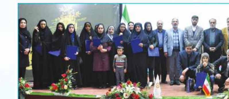
مجموعه ای از مسئولان و نمایندگان در مراسم بزرگداشت هفته کتاب.