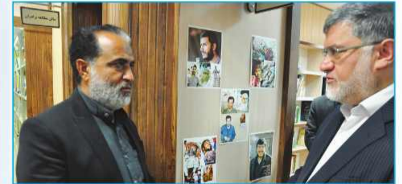
مجموعه ای از کتابداران نمونه و حامیان کتابخانه های استان در مراسم تجلیل به عمل آمد.

از کتابداران نمونه و حامیان کتابخانه های استان تجلیل به عمل آمد.