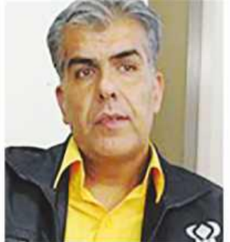
خبریت برگزار خواهد شد و مانور نمادین استانی در شهرستان بیرجند و آموزشگاه نمونه شهید مطهری برگزار می شود.

در مدارس به منظور ارتقای آمادگی دانش آموزان و ترویج فرهنگ ایمنی در برابر زلزله بر اساس تفاهم نامه ستاد عالی آمادگی عمومی در برابر زلزله که بین وزارتخانه های علوم، تحقیقات و فناوری، آموزش و پرورش، وزارت کشور، همچنین سازمان صداوسیما و جمعیت هلال احمر منعقد گردیده است برگزار می گردد. او افزود: مأموریت برگزاری مانور سراسری زلزله در حوزه فعالیت های مرتبط با مدارس از طرف وزارت آموزش و پرورش به سازمان دانش آموزی محول گردیده است، بدین جهت و به منظور ارتقای آمادگی عمومی برای مواجهه با آثار زلزله، بیست و یکمین مانور سراسری زلزله و ایمنی با عنوان "مدرسه ایمن - جامعه تاب آور" روز چهارشنبه ۶ آذرماه در کلیه مدارس استان با محوریت آموزش و پرورش، سازمان دانش آموزی، مدیریت بحران استان و همکاری دستگاه های