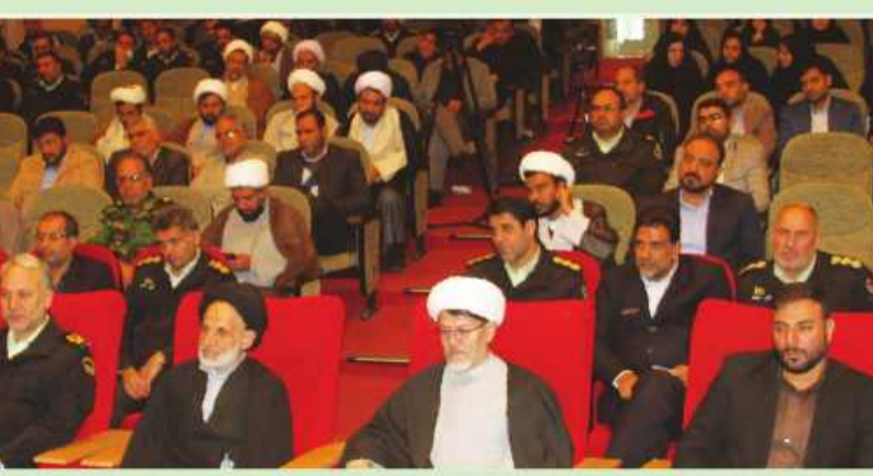
مدیر کل آموزش مجلس و استان های نهاد کتابخانه های عمومی کشور در نشست تخصصی استانی ناجا و جامعه اسلامی.

امروز خراسان جنوبی - حسین زاده نماینده ولی فقیه در استان و امام جمعه بیرجند گفت: در گام دوم انقلاب باید به آرمان های انقلاب نزدیک شویم و به سوی دولت اسلامی، جامعه اسلامی و تمدن اسلامی حرکت کنیم. حجت الاسلام والمسلمین سیدعلیرضا عبادی روز گذشته در نشست تخصصی استانی ناجا و جامعه اسلامی مبتنی بر منظومه فکری مقام معظم رهبری در سالن ایثار شهر بیرجند، افزود: مردم در سرنوشت شان تأثیرگذار هستند و به خصوص در نظام اسلامی ما که انتخاب با خود مردم است. وی در این نشست که به همت عقیدتی سیاسی فرماندهی انتظامی استان برگزار شد، اضافه کرد: بالاترین هنر انقلاب که به معجزه شبیه تر است این است که اختیار کشور و مردم را از استعمارگران گرفت و به خود مردم واگذار کرد و این خود مردم هستند که دولت ها را تعیین می کنند و چنانچه در این زمینه کم تفاوت شوند دولت و حکومت هم کم تفاوت خواهد شد و اگر حساس باشند، یک دولت حساس پای کار خواهد آمد.