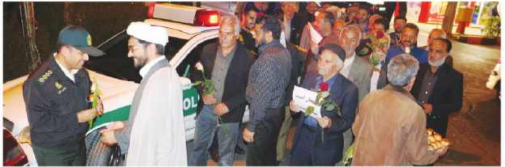
۶ آذر ماه در خراسان جنوبی برگزار می شود

جداً کرده و در همان روز اول مسالمت آمیز مطالبه خودشان را بیان کردند و هنگامی که دیدند ضد انقلاب و دشمن از این قضایا سوء استفاده می کند از آنان فاصله گرفتند. این بار هم تیر دشمن به سنگ خورد، امنیت و آرامش در استان خراسان جنوبی برقرار است، امنیتی که بواسطه زحمات شبانه روزی پلیس و نیروهای امنیتی و همدلی و همراهی مردم با پلیس به وجود آمده است.