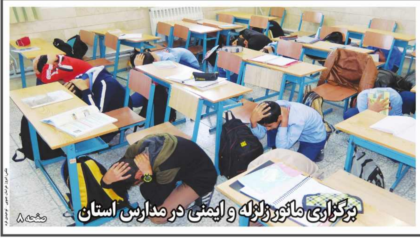
برگزاری مائورز لوله و ایمنی در مدارس استان

طرح های ایدرو؛ پیشران توسعه صنعتی استان | خراسان جنوبی در لیست ۵ استان اولویت دار کشور در زمینه ریل گذاری قرار گرفت | حداقل در هر شهرستان خراسان جنوبی یک طرح صنعتی اجرا شود | صفحه ۴