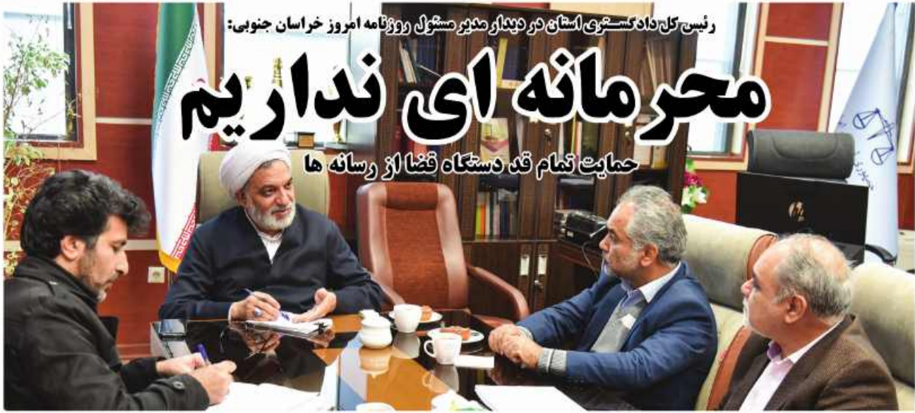
رئیس کل دادگستری استان در دیدار مشترک روزنامه امروز خراسان جنوبی: