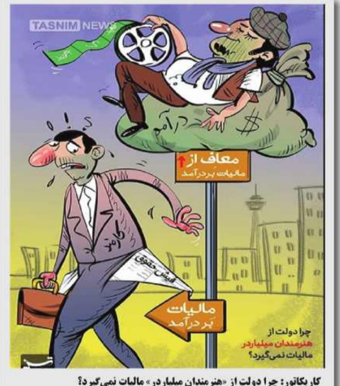
کار بکاتور: چرا دولت از «هنرمندان میلیاردی» مالیات نمی گیرد؟