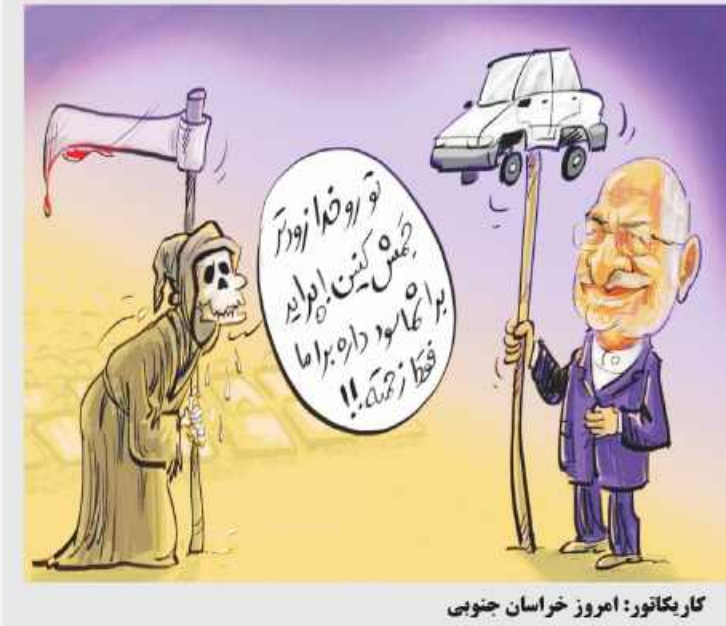
کاریکاتور: امروز خراسان جنوبی

مرزی خراسان جنوبی را داد گفتنی است، از آنجایی‌که جشنواره‌های گل‌ریزان در استانی کمک به امور خیریه و احداث اماکن عام‌المنفعه است لذا مبالغه و مساعدت‌های اهدایی طی جلسات هیأت منبره مجامع خیرین بررسی و با اولویت طرح‌ها توزیع می‌گردد. در نخستین جشنواره فرهنگی و ورزشی «شکوه پیوند طلایه مهربانی» دو طرح احداث دو پیست موتور کراس (۱۵ هزار نفری غنبد) و چندمنظوره امیرآباد بیرجند مطرح بود که مورد بررسی قرار نگرفت، همچنین ساخت خانه کشتی خراسان جنوبی از دیگر پروژه‌های خراسان جنوبی بود که باز هم توجهی به آن نشد.