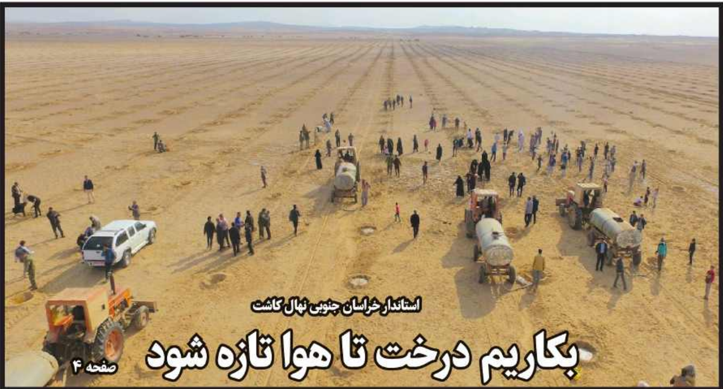
استاندار خراسان جنوبی نهال کاشت بکاریم درخت تا هوا تازه شود

پیام استاندار خراسان جنوبی به مناسبت روز دانشجو