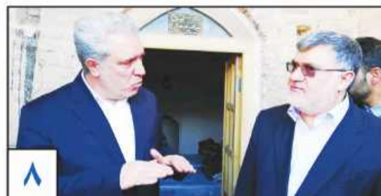
وزیر میراث فرهنگی از پیشنهاد اختصاص سهدیه بنزین برای سفرهای نوروزی به هیئت دولت خبر داد