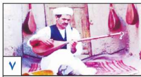
ساز ناکوک حمایت از موسیقی خراسان