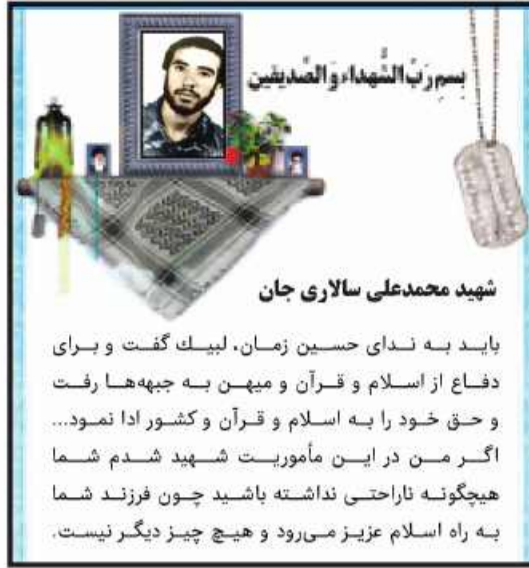
شهید محمدعلی سالاری جان