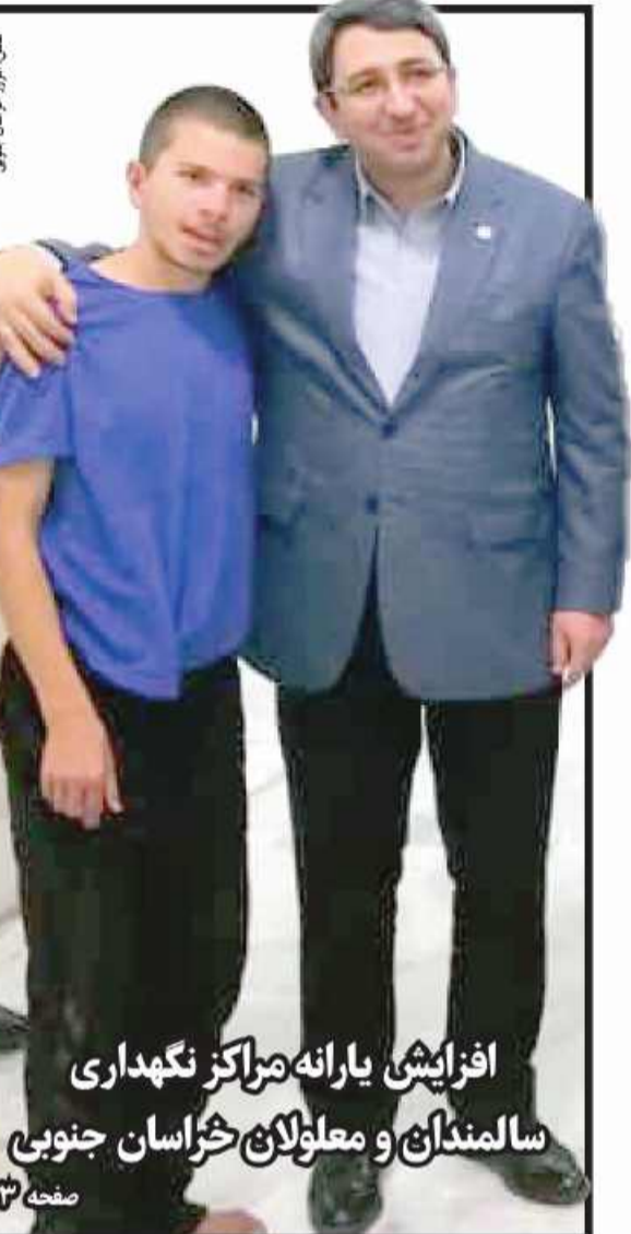
افزایش یارانه مراکز نگهداری سالمندان و معلولان خراسان جنوبی