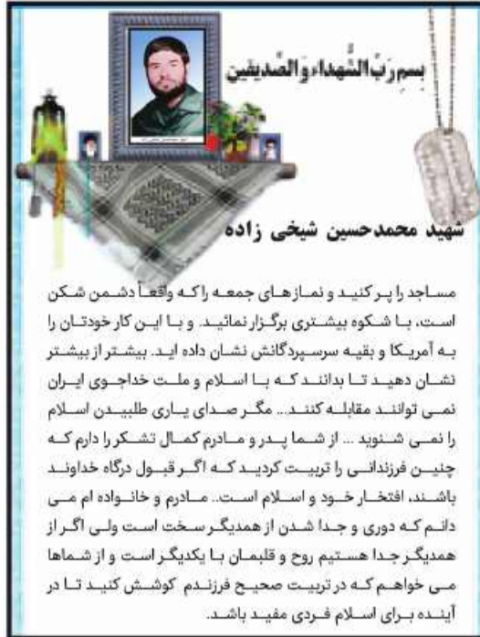
شهید محمدحسین شیخی زاده

مساجد را پر کنید و نمازهای جمعه را که واقعاً دشمن شکن است، با شکوه بیشتری برگزار نمائید. با این کار خودتان را به آمریکا و بقیه سرسپردگانش نشان داده اید. بیشتر از بیشتر نشان دهید تا بدانند که با اسلام و ملت خداجوی ایران نمی توانند مقابله کنند... مگر صدای یاری طلبیدن اسلام را نمی شنوید... از شما پدر و مادرم کمال تشکر را دارم که چنین فرزندی را تربیت کردید که اگر قبول درگاه خداوند باشند، افتخار خود و اسلام است. مادرم و خانواده ام می دانم که دوری و جدا شدن از همدیگر سخت است ولی اگر از همدیگر جدا هستیم روح و قلبمان با یکدیگر است و از شماها می خواهم که در تربیت صحیح فرزندم کوشش کنید تا در آینده برای اسلام فردی مفید باشد.