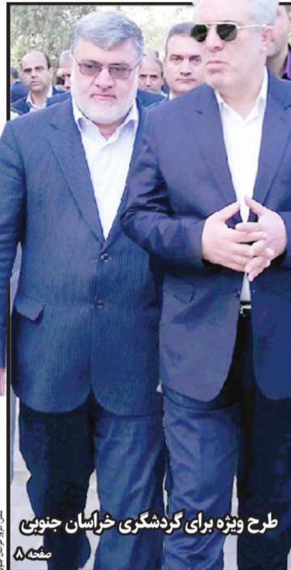
طرح ویژه برای گردشگری خراسان جنوبی

ولادت مظهر مهربانی و عطفوت عقیده بنی هاشم حضرت زینب کبری(س) و روز پرستار مبارک