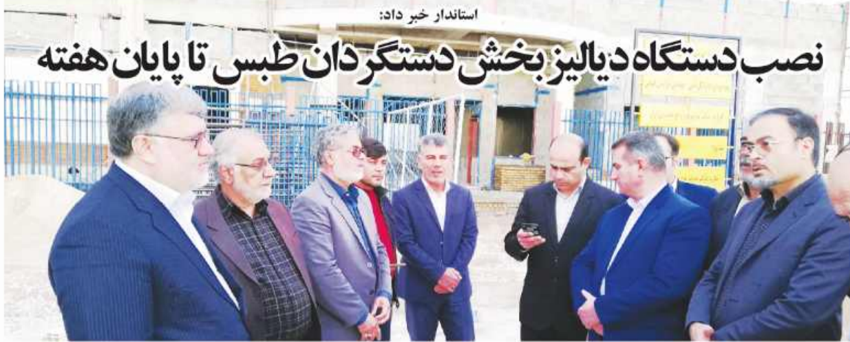
استاندار خبر داد:

بازماندگانم! این جمهوری اسلامی که خونهای هزاران شهید می باشد و بدست من و شما سپرده شده است باید پاسدار آن باشیم و آن هم جز با نثار خون میسر نمی شود. بگذار در کربلای ایران قطره خونی که دارم، تقدیم راه اسلام و امام نمایم... و بدانید که شما مسئولیتان سنگین تر است و آن رساندن پیام شهیدان به گوش جهانیان و دنیای اسلام است. در ایفای این مسئولیت کوشا باشید.