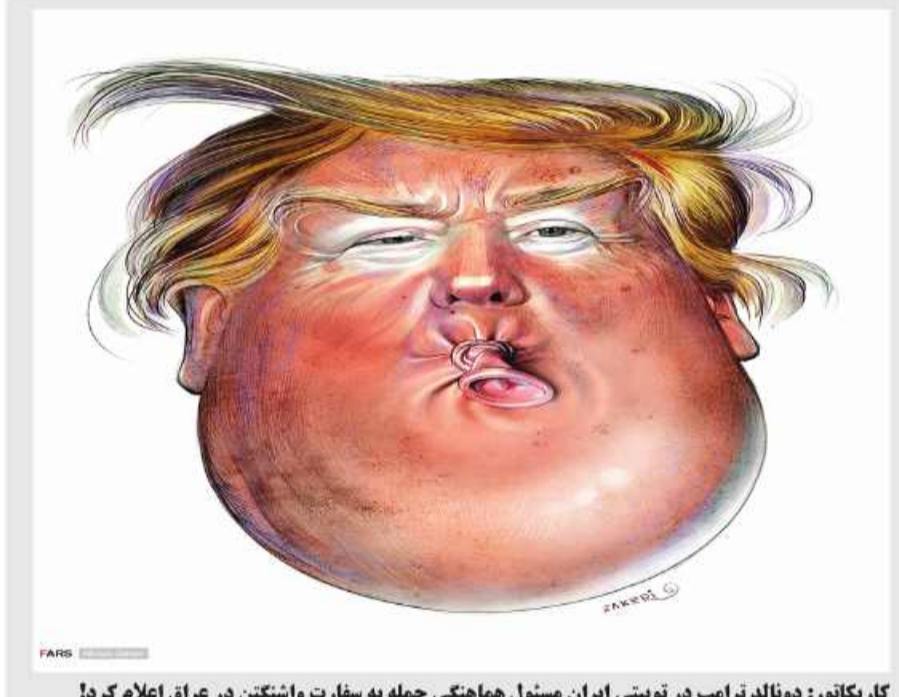
کار بکاتور: دونالد ترامپ در توییتهای ایران مسئول هماهنگی حمله به سفارت واشنگتن در عراق اعلام کرد!

بانوان بشرویه ای با شرکت در جشنواره فرهنگی ورزشی محله ای زینبیون یک روز باشا ط را تجربه کردند. به گزارش امروز خراسان جنوبی، این جشنواره سه شنبه شب به مناسبت میلاد عقیده بنی هاشم (ع) برگزار شد و بانوان ضمن برگزاری