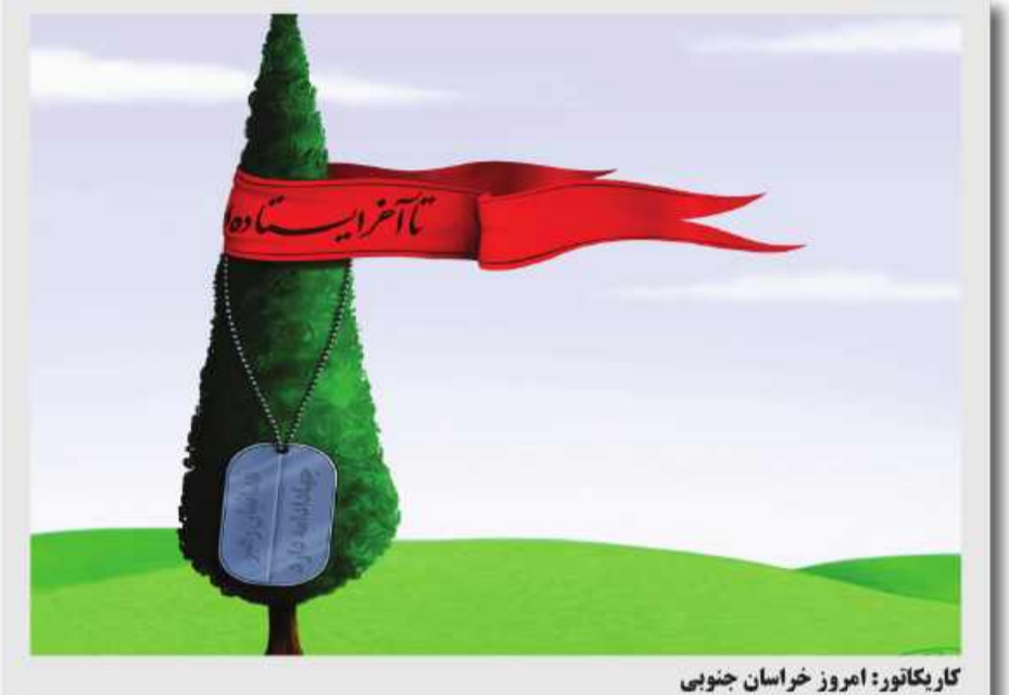
کار بکاتور: امروز خراسان جنوبی

مرکز روابط عمومی و امور بین الملل اداره کل ورزش و جوانان خراسان جنوبی اعلام کرد: در پی شهادت شهید عالی مقام سپهبد حاج قاسم سلیمانی و شهدای همراه وی بویژه مجاهد بزرگ اسلام ابومهدی المهندس و اعلام سه روز عزای عمومی از سوی مقام معظم رهبری، کلیه مسابقات ورزشی از جمعه ۱۳ دی ماه به مدت سه روز در مرکز استان و تمامی شهرستانها برگزار نخواهد شد.