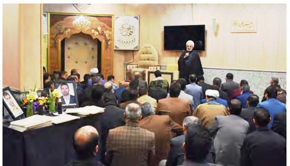
جلسه فوق العاده شورای شهر بیرجند؛