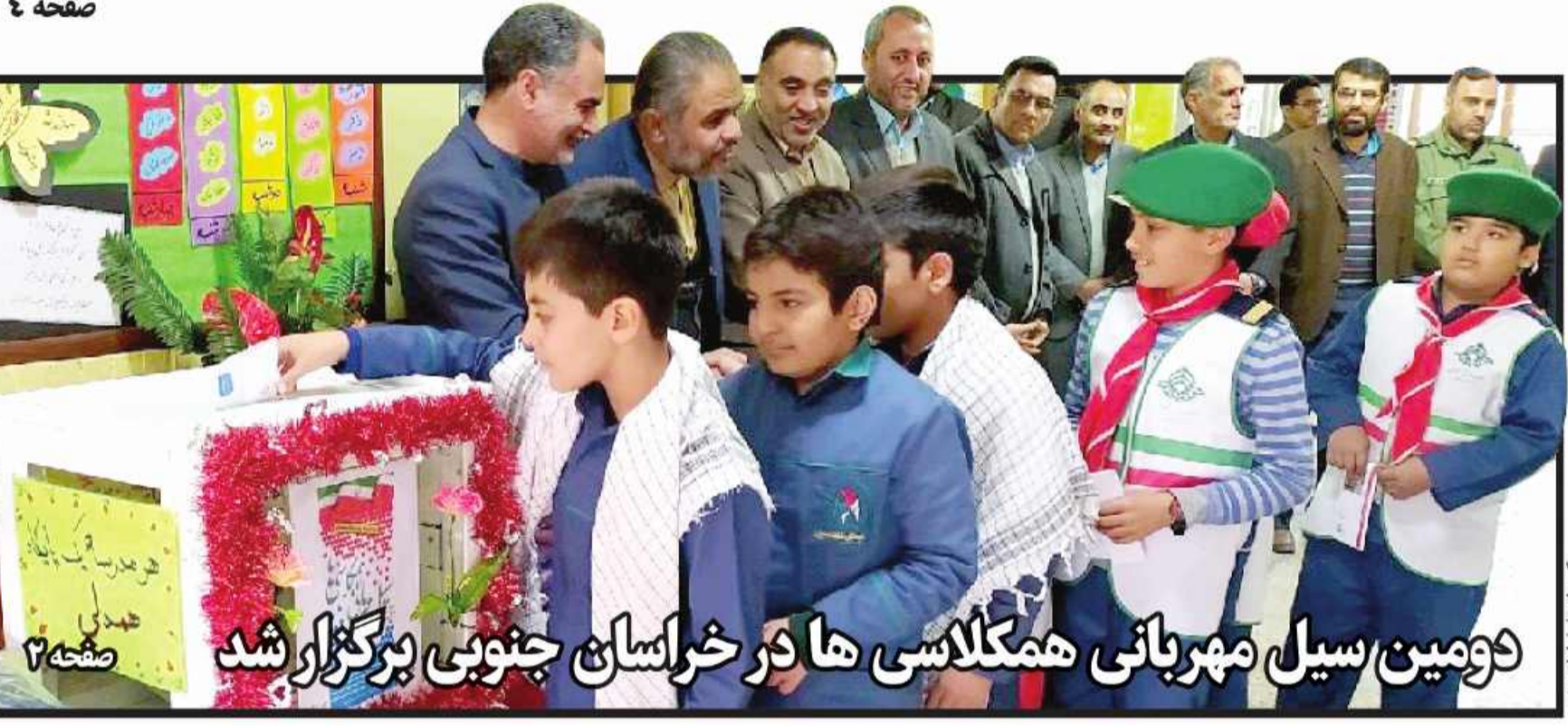
دومین سیل مهربانی همکلاسی ها در خراسان جنوبی برگزار شد