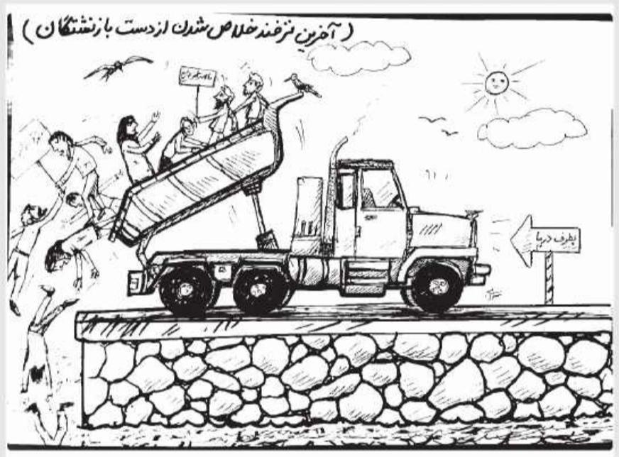
کار یگانور: امروز خراسان جنوبی - سرابی

تیم کوهنوردی و صعودهای ورزشی استان جهت شرکت در مسابقات دره نوردی به استان های هرمزگان و بوشهر اعزام می شوند. به گزارش امروز خراسان جنوبی، در این برنامه که از ۲ تا ۱۲ بهمن ماه برگزار خواهد شد،