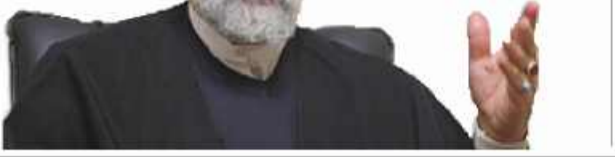
آیت الله سیدابراهیم رئیسی

آیت الله سیدابراهیم رئیسی رئیس قوه قضائیه گفت: «اقتصاد را شرطی کردن به شرطی که او نگاه کند، امضا کند، لایحه بزند خطاست. باید اقتصاد با تعامل با همه کشورها باشد؛ ما با همه کشورها تعامل داریم به غیر از آنهایی که با ما دشمنی می ورزند. نباید منتظر لایحه، اقدام و اراده دیگران بود، اینکه اقتصاد را شرطی کنیم تا دیگران تصمیم بگیرند درست نیست. اگر فعال اقتصادی دچار مشکل شد، باید به دستگاه نظارتی مراجعه کرده و در آنجا حمایت شود. اگر در کشور مالی، پولی و اولویت با تولید است، باید تسهیلات تعلق بگیرد نه دلالت، فضای تولید را دچار آسیب کند.»