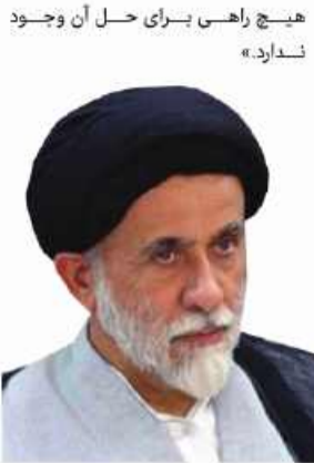
آیت الله العظمی آیت الله علی خامنه ای

نیت خوانی می کنند و بر چه اساسی فردی که نماز می خواند، روزی می گیرد و حتی روحانی است که علاوه بر پایبندی به احکام اسلام ۵۰ سال مروج احکام است را بر اساس عدم الزام عملی به اسلام درصلاحت می کنند. در واقع این اوضاع از دوره چهارم مجلس حاکم شده است. بعد از آن هم در دوره پنجم قانون نظارت استصوابی تصویب شد و به شورای نگهبان رفت، به هر صورت این مشکل به وجود آمد و