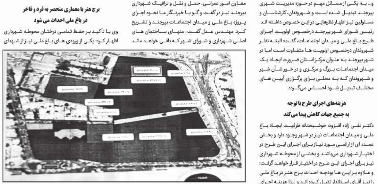
مابقی نقاط در حد فاصل حاشیه شمالی میدان ایبوتر (از ساختمان راهنمایی و رانندگی تا بازارچه ایبوتر) به سمت شمال تا شهدای یک و امتداد آن اراضی سابق یادگان منتهی به بخشی از حاشیه جنوبی شهید قرنی از شمال و منتهی به پشت املاک حاشیه غربی صیاد شیرازی به سمت حاشیه شمالی ارتش، جزو محدوده طرح میدان اجتماعات و باغ ملی بیرجند خواهد بود.

امروز خراسان جنوبی - حسین زاده hosein.zadebirjandtoday.ir طرح احداث باغ ملی و میدان اجتماعات در بیرجند، اولویت داشتن یا نداشتن این طرح، نحوه اجرای آن و... به یکی از مسائل مهم در حوزه مدیریت شهری بیرجند تبدیل شده است و شهروندان، کارشناسان و مسئولین نیز اظهار نظرهایی در این خصوص داشته اند. رئیس شورای شهر بیرجند در خصوص اولویت اجرای طرح باغ ملی و میدان اجتماعات، گفت: البته نظر شهروندان در خصوص اولویت ها متفاوت است اما در شهر بیرجند به عنوان مرکز استان ضرورت ایجاد یک میدان اجتماعات بزرگ و مرکزی و در خور شان شهر و شهروندان که به محلی برای برگزاری آیین های مختلف تبدیل شود احساس می گردد.