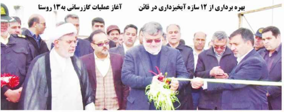
بهره برداری از ۱۲ سازه آبخیزداری در قائن آغاز عملیات گازرسانی به ۱۳ روستا