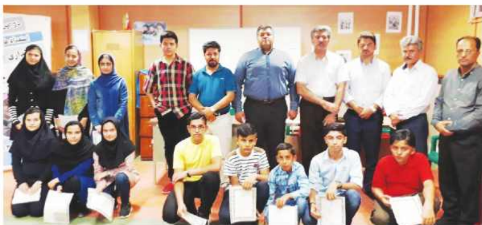
تومان است با قیمت پراید برابری می کند.

دبیر هیئت تیراندازی استان با بیان اینکه ورزشکاران با استعدادهای داریم، عنوان کرد: همچنین مربیان به روز و با تجربه ای داریم و این دو ایتم ورزشکار و مربی، بحث نرم افزاری می باشد که ما مشکل نداریم و مشکل ما فقط در سخت افزار می باشد. سلیمانی با اشاره به اینکه مشکل سالن تا ۴ سال آینده برطرف می شود، تصریح کرد: اما مشکلات دیگری داریم که نیازمند حمایت بخش خصوصی و اداره کل ورزش می باشد. وی ادامه داد: یکی از مهمترین مشکلات ما فرسوده بودن سلاح ها می باشد که یکی از گزینه های مهم در مقام آوری ست و دیگر استان ها از سلاح های به روز استفاده می کنند. به گفته وی اینکه هیئت می شود قیمت سلاح بالاست و اداره کل ورزش نمی تواند تأمین کند را قبول نداریم چرا که قیمت ها بالا رفته یعنی در ۱۰ سال قبل که آقای قدیری مدیرکل وقت برای نجمه خدمتی سلاح خریداری کرد قیمت آن با قیمت پراید یکی بود و اکنون هم که سلاح حدود ۶۰ میلیون