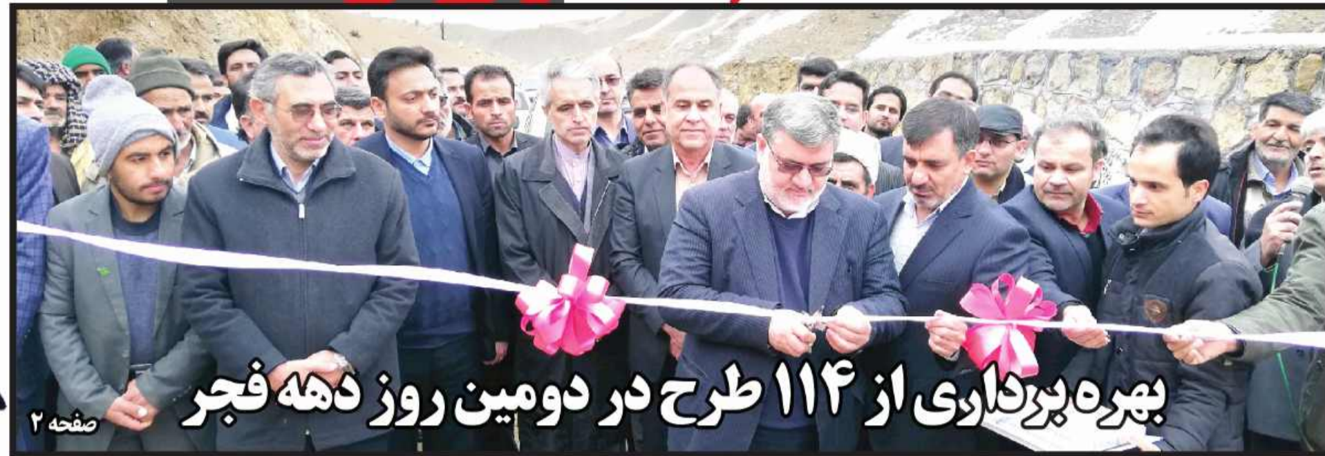
بهره برداری از ۱۱۴ طرح در دومین روز دهه فجر