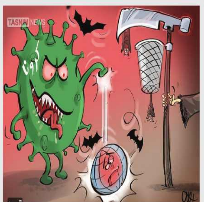
کار یکاتوره؛ ویروس کرونا در حال فوینتر شدن