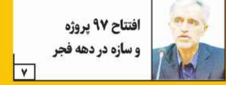
افتتاح ۹۷ پروژه و سازه در دهه فجر