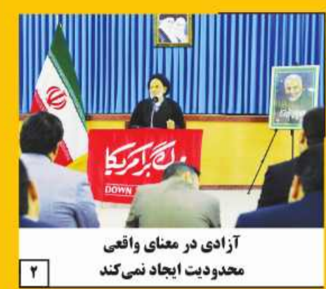
آزادی در معنای واقعی محدودیت ایجاد نمی کند