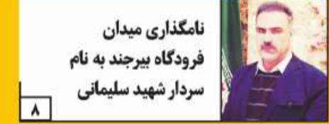
نامگذاری میدان فرودگاه بیرجند به نام سردار شهید سلیمانی