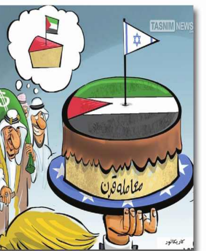
کاریکاتور: معامله قرن

داد: از اواسط آبان ماه که طرح آزمون وسیع اجرایی شده تاکنون ۳۴۸۱ نفر متقاضی در سامانه ثبت نام کرده اند که از این تعداد برای ۳ هزار و ۲۴ نفر پیامک ارسال شده و جواب خود را دریافت کرده اند و از این تعداد ۱۱۸۴ نفر یعنی ۳۰ درصد ثبت نام کنندگان هم تحت پوشش بیمه سلامت رایگان قرار گرفته اند. سامانه ۱۶۶۶ دوشنبه در میان پاسخگویی بیمه شدگان سلامت استان به صورت ویژه مدیرکل بیمه سلامت خراسان جنوبی هم در این نشست با بیان اینکه بیمه شدگان سلامت در سراسر استان می توانند مشکلات، دغدغه ها و سوالات احتمالی خود را بصورت ۲۴ ساعته از طریق سامانه ۱۶۶۶ دریافت کنند، گفت: من و معاونان بیمه سلامت استان دوشنبه در میان از ساعت ۱۰ تا ۱۱ بصورت آنلاین پاسخگویی سوالات مردمی هستیم ولی جای این گله وجود دارد که مردم گاها از این ظرفیت استفاده نمی کنند و ممکن است برایشان موقع مراجعه به مراکز بهداشتی درمانی مشکلی ایجاد شود. دکتر اربابی با اشاره به اینکه دوشنبه هفته جاری نوبت پاسخگویی مسئولان سازمان به مردم استان بوده، ادامه داد: یکی از مواردی که باید اطلاع رسانی شود و بیمه شدگان گاها از آن بی اطلاع اند و یا دقت نمی کنند عدم اعتبار دفترچه بیمه ای آنهاست که در صورت مراجعه به بیمارستان و بستری شدن اگر دفترچه فاقد بیمه باشد باید هزینه آن باز زمانی تا تمدید دفترچه را آزاد بپردازند. وضعیت عملکردی بیمه سلامت در سال جاری مطلوب پیش بینی می شود وی وضعیت عملکردی بیمه سلامت را در سال جاری مناسب، متعارف و مطلوب اعلام کرد و با بیان اینکه اگر از سنوات گذشته جلوتر نباشیم عقب تر نیستیم، ادامه داد: در بحث نظارت بر ارائه خدمات