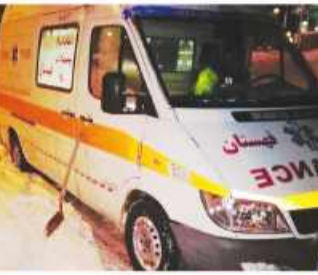
پرسنل اورژانس در حال انتقال گرفتاران از برف و کولاک

توقف و گیرکردن این افراد شده بود، افزود: با تلاش خادساندانه پرسنل اورژانس به همراه پلیس، هلال احمر و همراهانشان که در برف و کولاک گرفتار شده بودند خبر داد. دکتر جلال احمدی در این زمینه گفت: به دنبال گرفتار شدن ۲ مادر باردار با ۵ نفر همراه در دو خودرو در مسیرهای کوهستانی شهرستان دریمان، تلاش نفس گیر پرسنل اورژانس برای رها سازی آنان از ساعات پایانی ۱۳ بهمن ماه آغاز شد. وی با بیان اینکه انسداد مسیر و لغزندگی جاده به دنبال برف و کولاک و عدم دسترسی به امکانات مخابراتی و درخواست کمک از یگان های امدادی منجر به