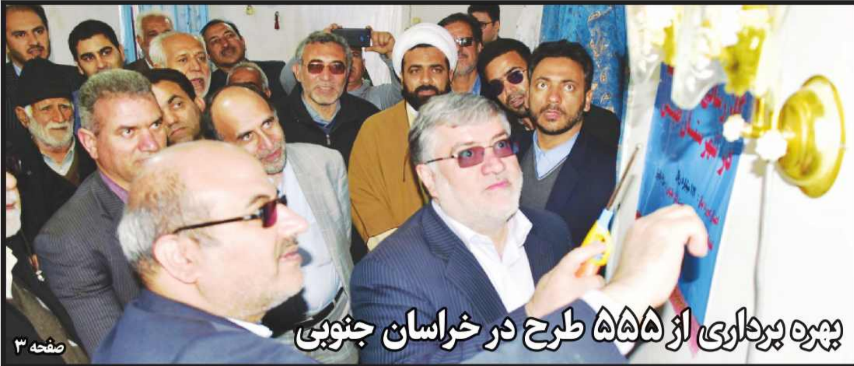
پیره پرداری از ۵۵۵ طرح در خراسان جنوبی

امام جمعه بیرجند بر مقابله با توطئه های دشمن تأکید کرد