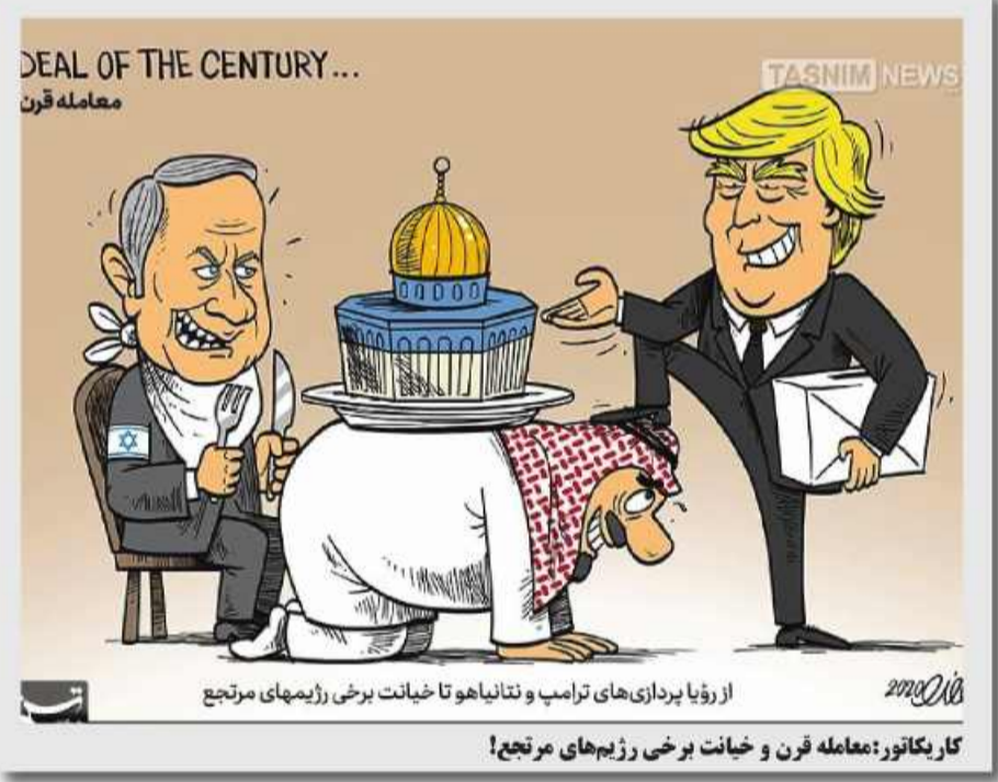
از رویا پردازی های ترامپ و نتانیاهو تا خیانت برخی رژیمهای مرتجع کارکنانکو: معامله قرن و خیانت برخی رژیم های مرتجع!