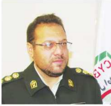
تحت تعقیب قرار می گیرند.

امروز خراسان جنوبی - حسین زاده hoseinzade@birjandtoday.ir