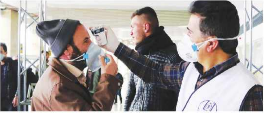
برای فرزندان در تاب آوری الگو باشیم