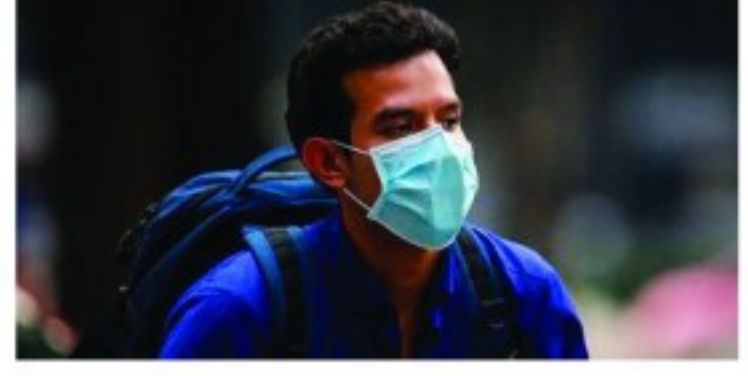
به شمار می رود. دکتر آهنی افزود نظارت بر توزیع ماسک اگر بدون توزیع این ماسک های تولیدی هم به خبرنگار ماسک تاکنون ماسکی در اختیار دانشگاه قرار

وی با تاکید بر اینکه ماسک های که بصورت خانگی دوخته و در سطح بازار عرضه می شود به هیچ عنوان مورد تایید وزارت بهداشت نیست. اضافه داد بر اساس اعلام نظر تولید کنندگان ماسک که از دانشگاه مجوز اخذ کرده اند تاکنون تولید روزانه ۲۵ هزار ماسک در استان وجود دارد. وی در مورد