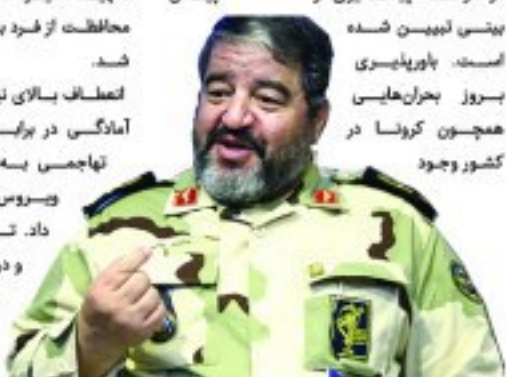
سردار جلالی رئیس سازمان پدافند غیرعامل گفت: اقدامات سازمان پدافند غیرعامل در مرحله پیشگیری و پیش بینی نهی شده است. پاورپوینتی بروز بحران‌هایی همچون کرونا در کشور وجود

نداشت. ساختارهای تشخیصی و آزمایشگاه‌ها برای همه کشورهای جهان یک گلوگاه است. تهدید ذخیره استراتژیک تجهیزات و البته محافظت از فرد به دستگاه‌های متولی اسلام شد. تعطیل بالای نیروهای مسلح برای ایجاد آمادگی در برابر تهدید زیستی رویکرد تهاجمی به بهسازی توانست شیوع ویروس را به طور نسبی کاهش داد. تاب آوری دستگاه سلامت و درمان، از نقاط قوت کشور است. نکته فتواگونه رهبری حجت را بر همه از جمله مسئولان و متولیان مراکز