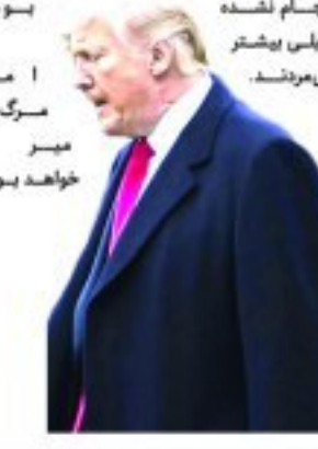
آمریکا و مرگ میسر خواهد بود.

دونالد ترامپ رئیس‌جمهور آمریکا در جریان گزارش روزانه خود درباره آخرین وضعیت شیوع ویروس کرونا در این کشور گفت: احتمالا بیس این هفته و هفته آینده، سخت‌ترین دو هفته را خواهیم داشت. متأسفانه شاهد مرگ بسیاری خواهیم بود اما اگر این کارها انجام نشده، خیلی بیشتر می‌مردند.