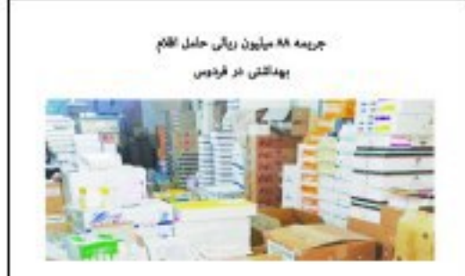
چهره ۸۸ میلیون ریالی حامل نام پوداشن در فردوس