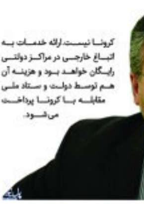
کرونا نیست لایه خدمات به اتباع خارجی در مراکز دولتی رایگان خواهد بود و هزینه آن هم توسط دولت و ستاد ملی مقابله با کرونا پرداخت می‌شود.

از ویروس شناسان معتقدند در حالت طبیعی، تطابق ویروس کرونا برای اینکه میزبان خود را از خفاش به انسان تغییر دهد ۲۰۰ سال به طول خواهد انجامید و وقتی این انتقال به چند سال انجام شده است یعنی در این میان یک تسهیلگر یا اصطلاحا کاتالیزوری وجود داشته است که عاملان با تصادفی این اتفاق افتاده است. یک کمیته حقیقت یاب توسط کشورهای مستقل از اعمال نفوذ سایر کشورها مانند آمریکا برای بررسی جوانب این موضوع شکل بگیرد. چونکه از آزمایشگاه‌های متهمان بازپرس کرده و از آنها در مورد اقداماتشان در مورد این ویروس گزارش خواستی انجام شود