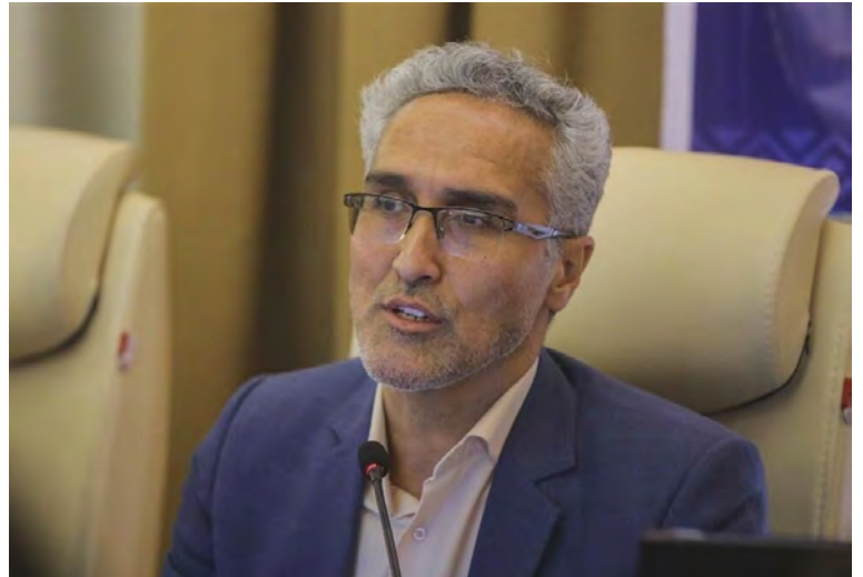
هزار نفر جمعیت را داشته باشیم.

رییس دانشگاه علوم پزشکی بیرجند گفت: اگر اصول و نکات بهداشتی رعایت نشود این روند فرسایشی موارد مثبت کرونا کماکان ادامه خواهد داشت.