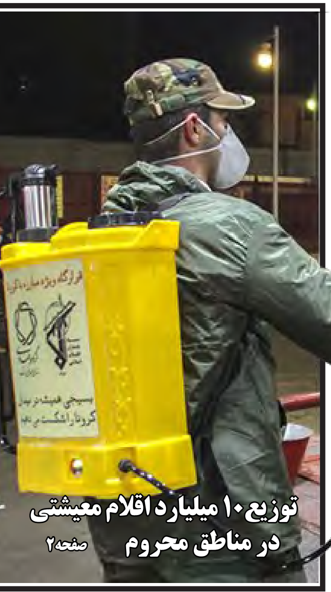
توزیع ۱۰ میلیارد ارقام معیشتی در مناطق محروم صفحه ۲

در دیدار نماینده منتخب با مسئولان حوزه بهداشت و درمان استان اعلام شد: