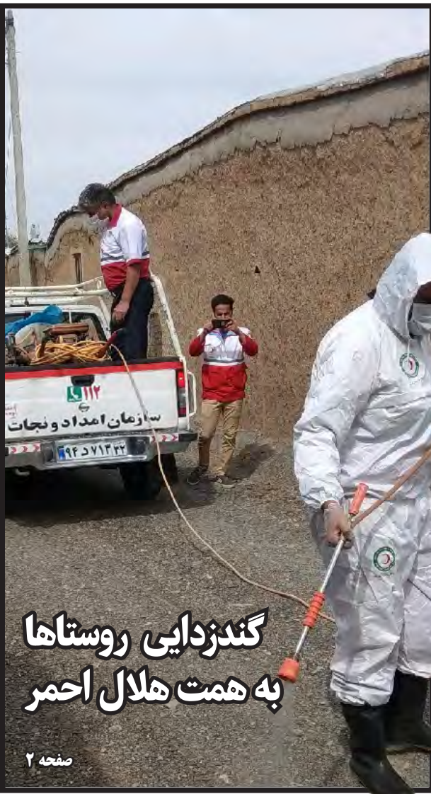
گندزدایی روستاها به همت هلال احمر