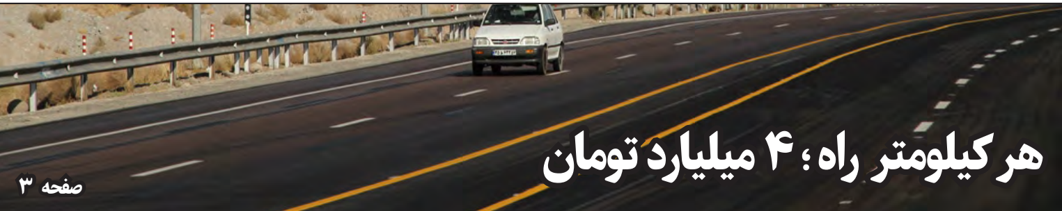
هر کیلومتر راه؛ ۴ میلیارد تومان

۲ نام نویسی کلاس اولی‌ها در طرح سنجش از نیمه دوم تیر