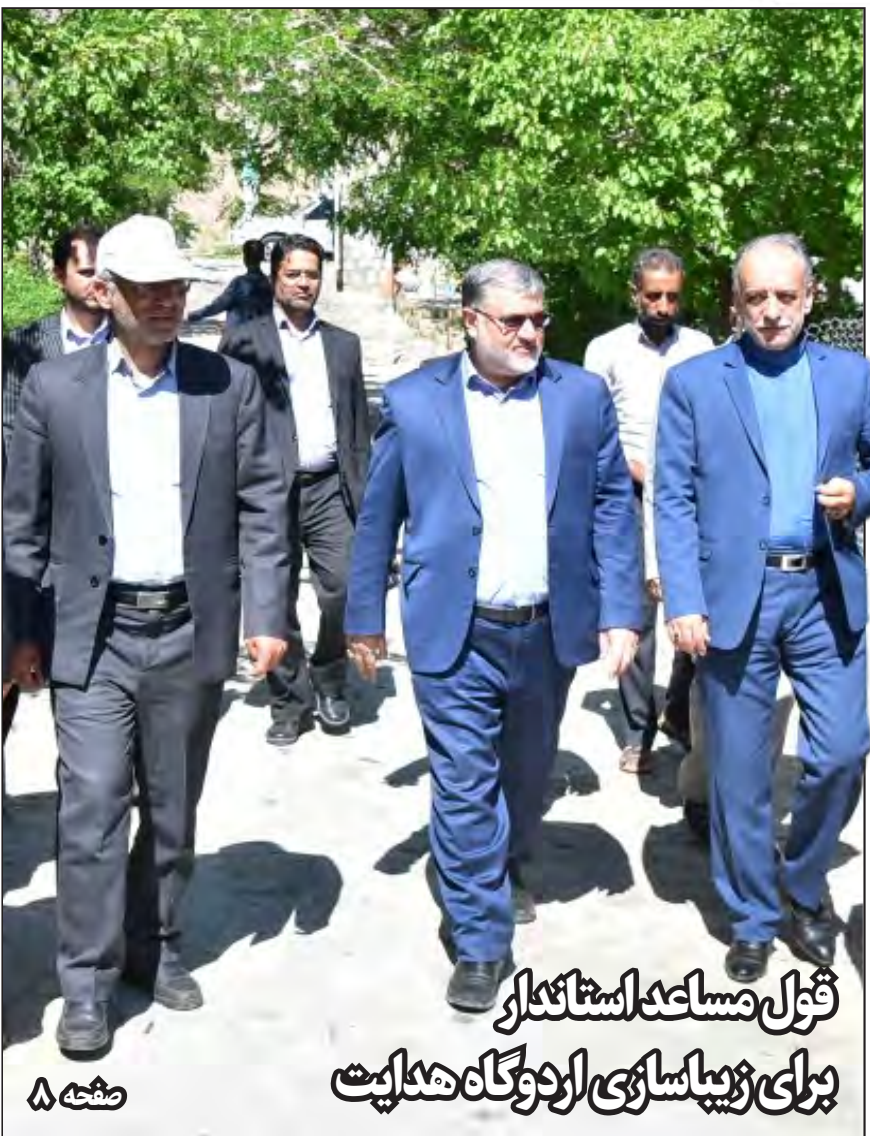
قول مساعد استنادکار برای زیباسازی اردوگاه هدایت

تلفن: ۰۹۱۵۸۶۳۰۷۱۰ - ۰۹۱۵۸۶۳۰۹۱ - ۳۲۳۵۰۹۱