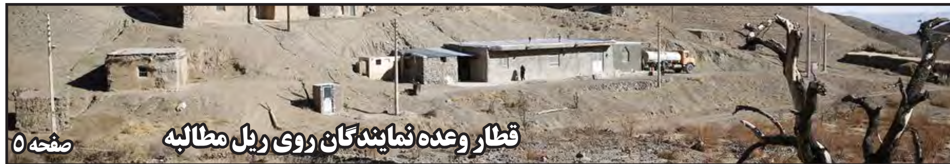
قطار وعده نمایندگان روی ریل مطالبه