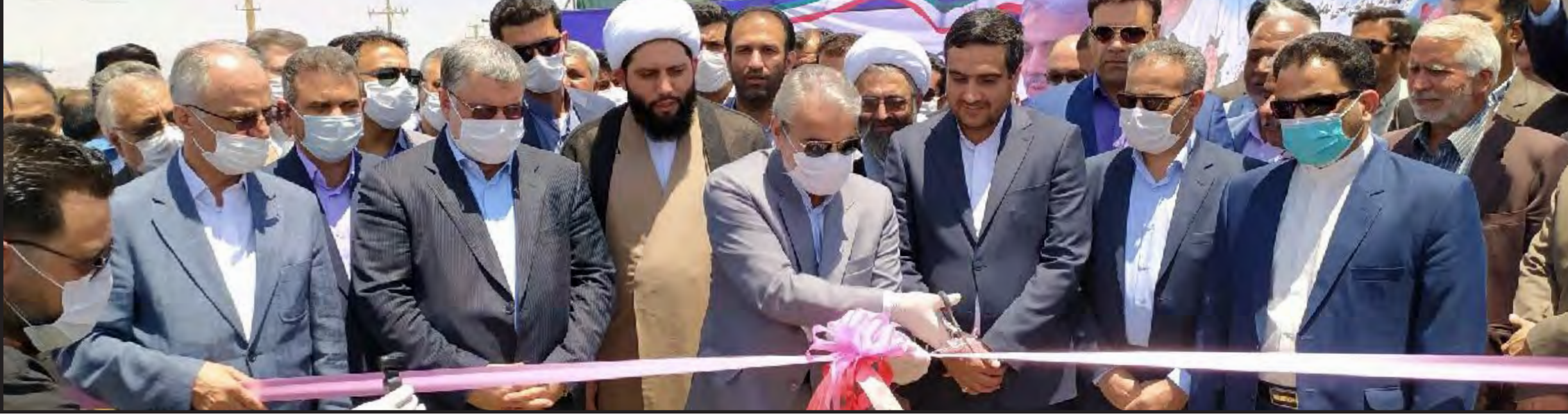
با حضور معاون رئیس جمهور و رئیس اداری مالی کمیته امداد کشور صورت گرفت: