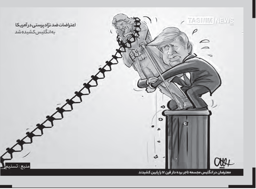
اعتراضات ضد نژادپرستی در آمریکا به انگلیس کشیده شد