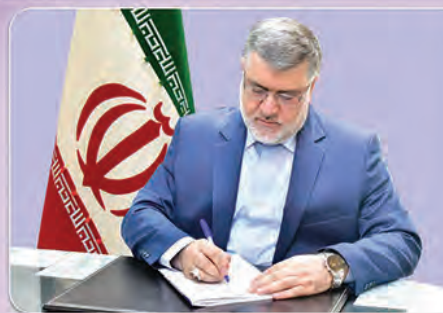
محمد صادق معتمدیان استاندار خراسان جنوبی

هفتم تیر ماه یادآور عروج مظلومانه مجاهد نستوه شهید آیت... بهشتی و ۷۲ تن از یاران وفادار انقلاب اسلامی است که در راستای تجلیل از معمار بزرگ دستگاه قضایی کشور، «روز قوه قضاییه» نامگذاری شده است. قوه قضاییه جمهوری اسلامی ایران به عنوان یکی از ارکان مهم نظام سیاسی کشور، نقش بی بدیلی در پاسداری از ارزش های اجتماعی، کرامت انسانی، احیای حقوق عمومی، پیشگیری از وقوع جرم و اجرای قانون اساسی بر عهده دارد. بر خورد قاطعانه با مفسدان اقتصادی در هر مقام و جایگاه، به مطالبه ای عمومی تبدیل شده که علاوه بر تقویت شفاف سازی، موجبات بسط و تحکیم سرمایه اجتماعی و رضایت عمومی را بیش از پیش فراهم می آورد. اینجانب ضمن گرامیداشت یاد و خاطره شهید بهشتی و یاران وفادار انقلاب اسلامی، هفته قوه قضاییه را به مجموعه متعهد این قوه، رئیس کل محترم دادگستری، دادستان محترم، قضات شریف، کارکنان و اعضای شوراهای حل اختلاف استان خراسان جنوبی که در امر حمایت از سرمایه گذاری و رونق تولید، پیشگیری از جرم و رسیدگی به دعاوی، تلاش های خالصانه ای داشته اند تبریک عرض نموده، موفقیت و تائیدات الهی در مسیر خدمت به نظام مقدس جمهوری اسلامی ایران را برای همه این عزیزان مسئلت دارم.