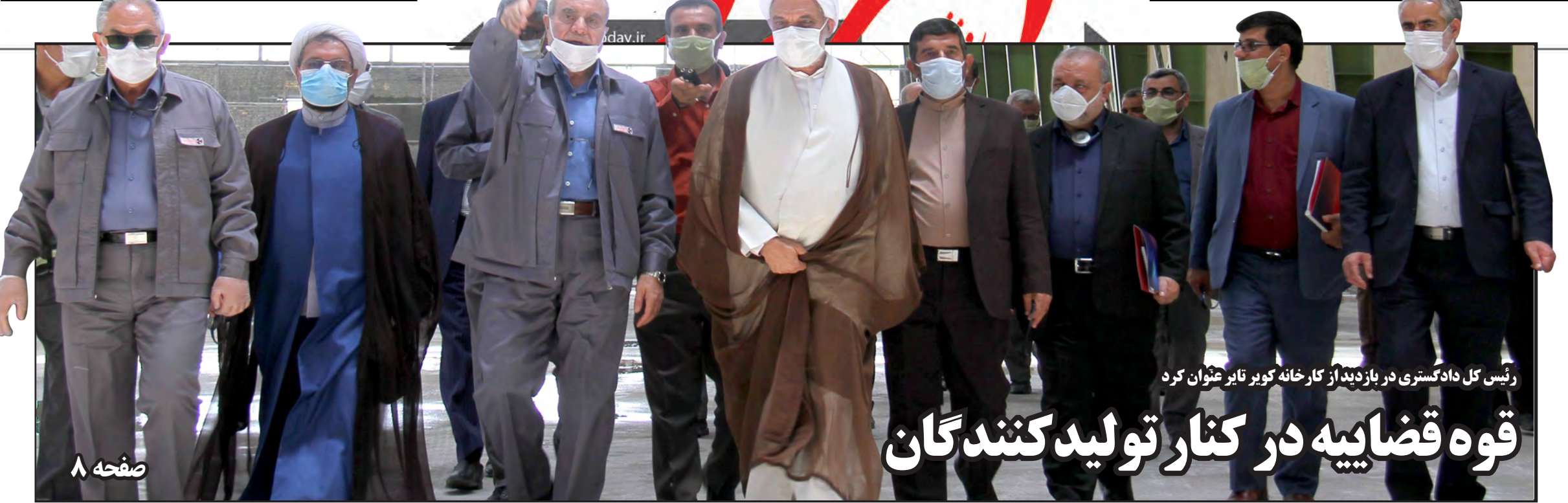
رئیس کل دادگستری در بازدید از کارخانه کویر تایر عنوان کرد