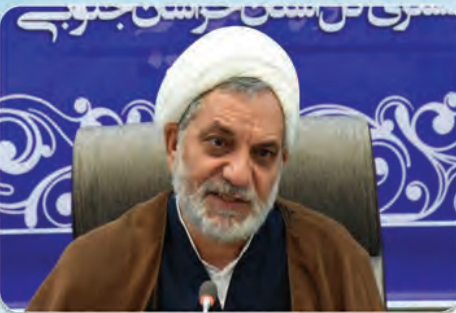
ابراهیم حمیدی - رئیس کل دادگستری استان خراسان جنوبی