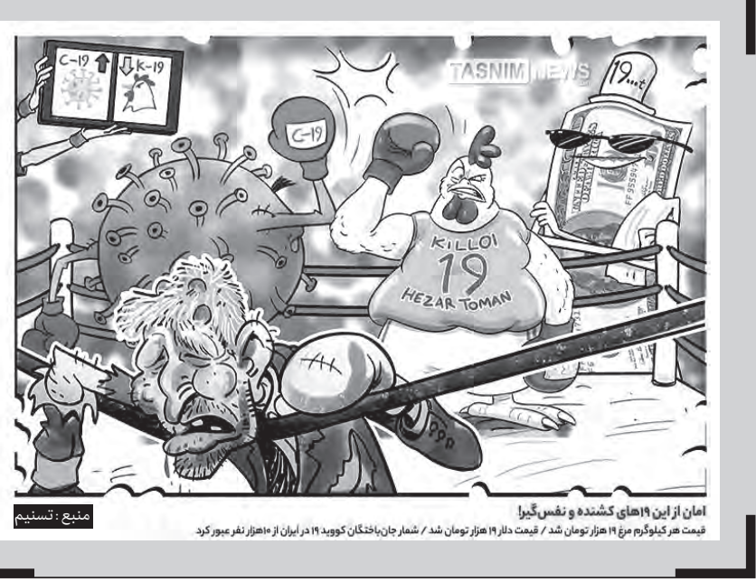
امان از این ۱۹های کشنده و نفس‌گیر / شمار جان‌باختگان کوید ۱۹ در ایران از چهار نفر عبور کرد / قیمت هر کیلوگرم مرغ ۱۹ هزار تومان شد / قیمت دلار ۱۹ هزار تومان شد / شمار جان‌باختگان کوید ۱۹ در ایران از چهار نفر عبور کرد