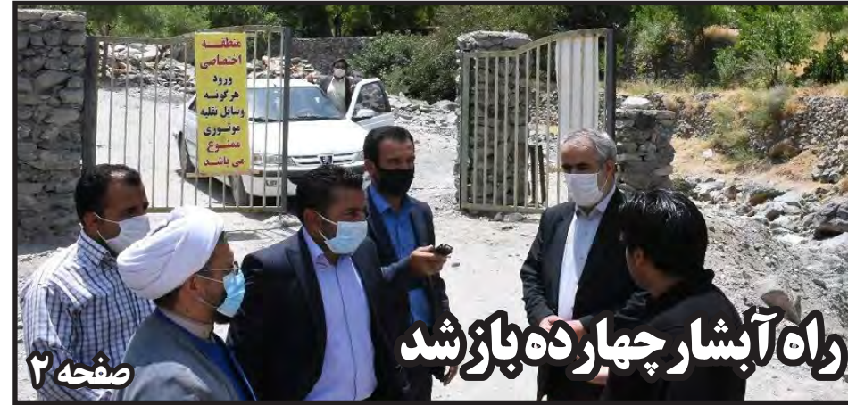
راه آبشار چهارده باز شد