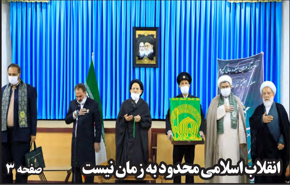
انقلاب اسلامی محدود به زمان نیست