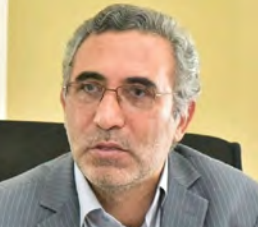
مدیرکل آموزش و پرورش خراسان جنوبی گفت: ۲۰ تیر ماه آزمون استخدامی قانون الحاق یک ماده به قانون تعیین تکلیف استخدامی معلمان حق التدریس و آموزشیاران نهضت سوادآموزی برای آموزشیاران و آموزش دهندگان مشمول به صورت حضوری برگزار می شود و ۷۶ آموزشیار استان باهم رقابت می کنند که از این تعداد ۶۸ نفر زن و ۸ نفر مرد هستند.

آبرسانی سیار به روستاها و مناطق عشایری خراسان جنوبی پس از ضرب الاجل استاندار به دستگاه های متولی، ۳۳ درصد افزایش یافت. معاون هماهنگی امور عمرانی استاندار تامین آب پایدار برای روستائیان را از مهمترین اولویتهای دولت دانست و گفت: پارسال آبرسانی سیار از ۶۰ لیتر به ۸۰ لیتر در روز برای هر خانوار رسید که برای امسال افزایش این مقدار به ۱۲۰ لیتر هدف گذاری شده است. میرجعفریان با اشاره به دستور استاندار به دستگاه های متولی برای تامین آب آشامیدنی مناطق روستایی و عشایری در جلسه هفتم تیر افزود: از آن تاریخ تاکنون حمل آب به این مناطق از ۵ هزار و ۲۰۰ مترمکعب در هفته، به ۷ هزار و ۲۰۰ مترمکعب رسیده است. وی گفت: با اضافه شدن ۷ دستگاه تانکر سیار، آبرسانی در ده روز گذشته برای هر خانوار از ۸۹ لیتر به ۱۰۰ لیتر در روز افزایش یافته است. وی با بیان اینکه هم اکنون ۵۰۰ روستای خراسان جنوبی در شرایط اوج تنش آبی و نیازمند آبرسانی سیار هستند افزود: از این تعداد ۳۶۰ روستا آب دارند، ولی برای تامین آب پایدار اهالی آن، با تانکر هم آبرسانی می شوند و ۱۴۰ روستا دیگر با بیشترین تنش آبی روبرو هستند که در اولویت آبرسانی قرار دارند.