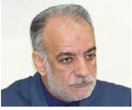
مدیرکل آموزش و پرورش خراسان جنوبی گفت: ۲۰ تیر ماه آزمون استخدامی قانون الحاق یک ماده به قانون تعیین تکلیف استخدامی معلمان حق التدریس و آموزشیاران نهضت سوادآموزی برای آموزشیاران و آموزش دهندگان مشمول به صورت حضوری برگزار می شود و ۷۶ آموزشیار استان باهم رقابت می کنند که از این تعداد ۶۸ نفر زن و ۸ نفر مرد هستند.