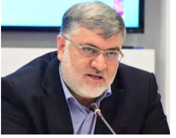
در مرکز سامد برای پاسخگویی شفاف در راستای رفع دغدغه های مردم مکلف شده اند.

آزمون فینال بهورزان در بیرجند برگزار شد آزمون فینال تئوری و عملی دوره ۳۰ بهورزی در بیرجند برگزار شد. در این آزمون تعداد ۲۰ نفر بهورزی خانم از شهرستان های بیرجند، نهبندان، سریشه، درمیان و خوسف که از تیرماه ۹۷ در مرکز آموزش بهورزی و بازآموزی برنامه های سلامت شهرستان بیرجند مشغول به تحصیل بودند، حضور داشتند.