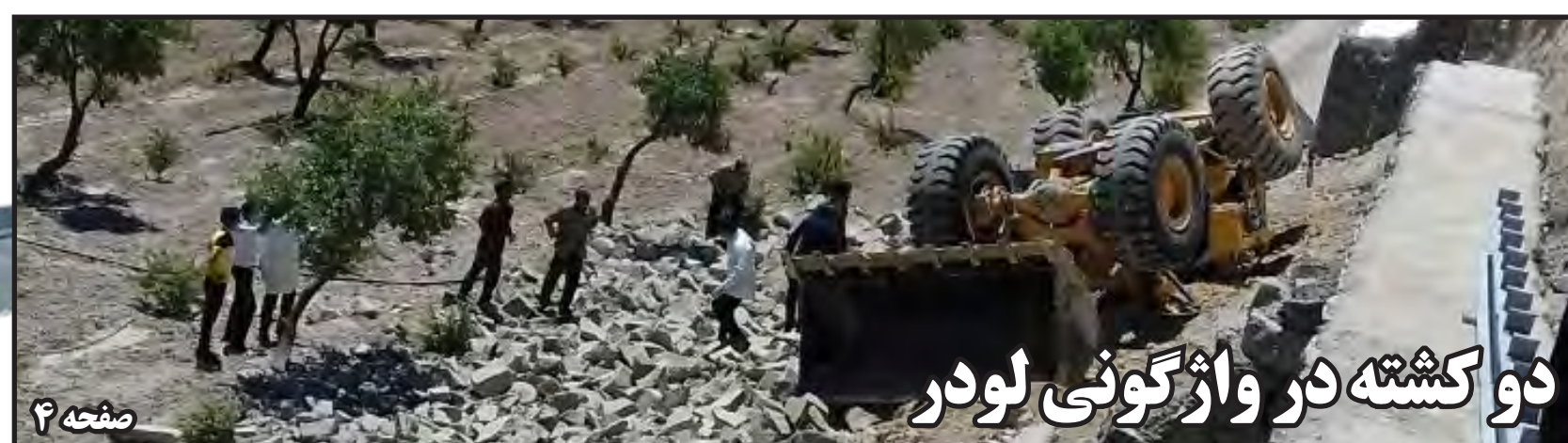
دو کشته در واژگونی لودر