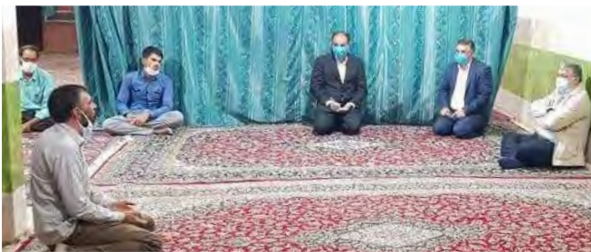
مسکن انقلاب اسلامی، جهاد کشاورزی، منابع طبیعی و آبخیزداری، صدا و سیما، راهداری و حمل و نقل جاده‌ای و شرکت گاز استان پیگیری کرد.

استاندار خراسان جنوبی به طور سرزده از روستاهای شهرستان سرپیشه بازدید و با مردم این منطقه مرزی گفت و گو کرد. محمدمصدق معتمدیان در این بازدید با اعضای شوراهای اسلامی، دهیاران و اهالی روستاهای نوغاب، دستگرد و کیدشت از توابع بخش مرکزی شهرستان سرپیشه، گفت و گو کرد.