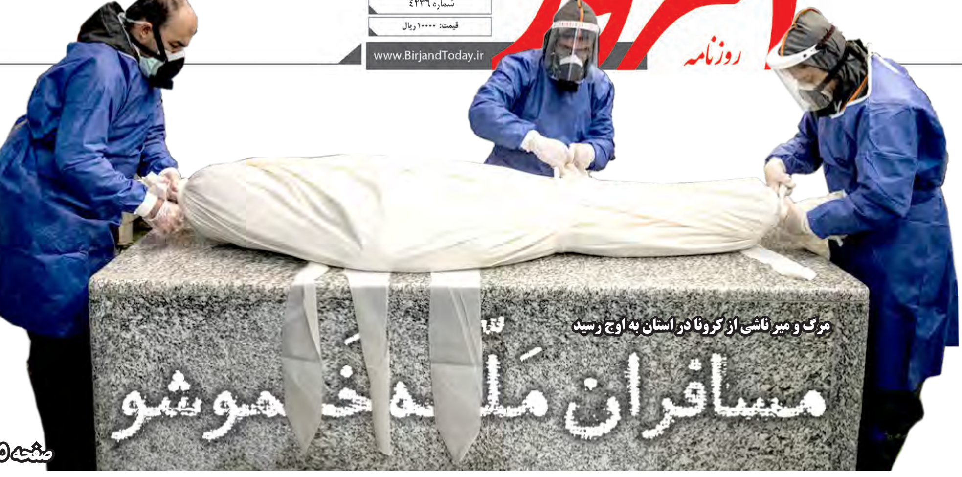
مرگ و میر ناشی از کرونا در استان به اوج رسید