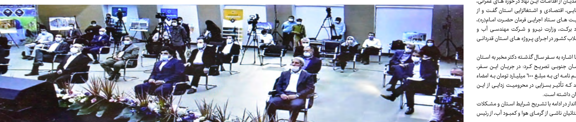
رئیس ستاد اجرایی فرمان حضرت امام (ره) در بازدید از پروژه آب شرب هزار روستا در سطح کشور حضور داشت و با مدیرعامل شرکت مهندسی آب و فاضلاب کشور و سایر مسئولان گفتگو کرد.

وی متذکر شد: امسال در زمینه اشتغالزایی ۱۰ هزار میلیارد تومان هزینه می کنیم. به گفته وی احداث ۴۰ هزار واحد مسکن محرومین، ۱۵ هزار واحد ویژه معلولان و ۵۰ هزار واحد از طرح اقدام ملی از جمله برنامه های نهاد در بحث تأمین مسکن می باشد. مساعادت ستاد اجرابی برای تکمیل پروژه اتصال ۵۰ روستای استان به شبکه آب شرب ستاد اجرایی فرمان حضرت امام (ره) با درخواست استاندار خراسان جنوبی مبنی بر مساعادت در تکمیل پروژه اتصال ۵۰ روستای استان به شبکه آب شرب بهداشتی موافقت کرد. معتمدیان این درخواست را در مراسم ویدئو کنفرانس امضاء تفاهم نامه ستاد اجرایی فرمان حضرت امام (ره) با شرکت مهندسی آب و فاضلاب کشور مطرح نمود. این مراسم با حضور مخبر رئیس ستاد اجرایی فرمان حضرت امام (ره) و جانباز مدیرعامل شرکت مهندسی آب و فاضلاب کشور به منظور رونمایی از پروژه تأمین آب شرب هزار روستا در سطح کشور برگزار شد. اعتبار مورد نیاز برای اجرای پروژه تأمین آب شرب هزار روستا که با مشارکت شرکت مهندسی آب و فاضلاب کشور و ستاد اجرایی فرمان حضرت امام (ره) انجام می شود، هزار میلیارد تومان است. معتمدیان در این مراسم،