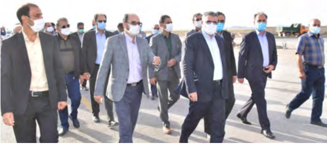
در ریدف مصوبات این جلسه بود که با قید ۲ شرط به تصویب رسید، یکی این که در واگذاری واحدها به افراد متقاضی کارشناسی های لازم صورت گیرد تا