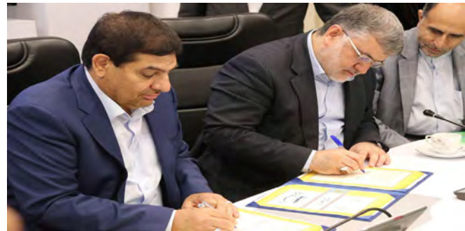
تاکتو ۱۰ میلیارد و ۶۴۰ میلیون تومان اعطاء کرده که پیش بینی می شود تا پایان امسال به بهره برداری برسد. وی گفت: این طرح ها شامل مشارکت