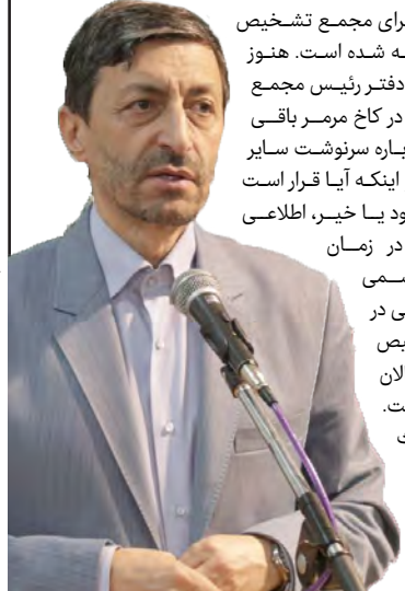
مجلس سابق هم برای مجمع تشخیص مصلحت در نظر گرفته شده است. هنوز قسمت‌های جزئی از دفتر رئیس مجمع تشخیص مصلحت در کاخ مرمر باقی مانده است؛ بنده درباره سرنوشت سایر بخش‌های این کاخ و اینکه آیا قرار است تبدیل به موزه شود یا خیر، اطلاعی ندارم. مرمر در زمان مرحوم آیت‌الله هاشمی رفسنجانی به طور کلی در اختیار مجمع تشخیص قرار داشت، اما الان به این صورت نیست. اطلاعاتی از احداث ساختمان ۹ طبقه شخصی در مرکز استراتژیک مجمع تشخیص ندارم.