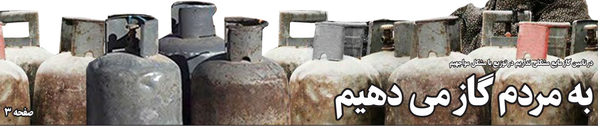
در تاسیخ گاز ملیع مشکلی نداریم در تهریز با مشکل مواجهیم