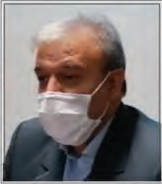
اجرای طرح جهاد آموزشی با همکاری ۱۶۰ دانشجو معلم در استان