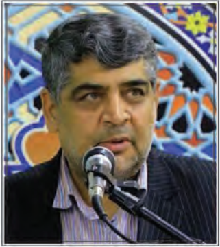
آغاز طرح تاپستانه کتاب در استان