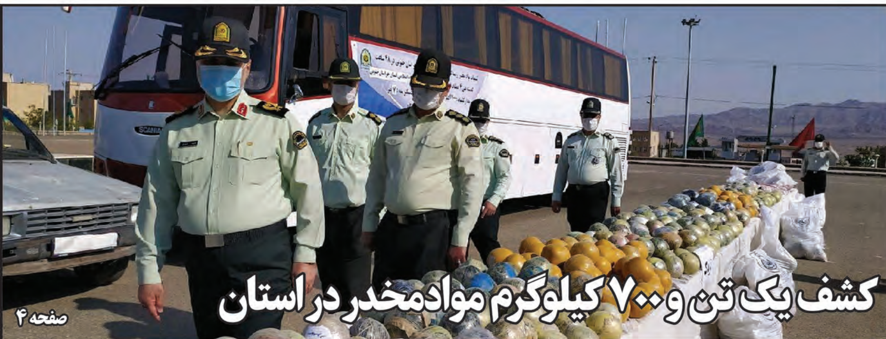
کشف یک تن و ۷۰۰ کیلوگرم موادمخدر در استان