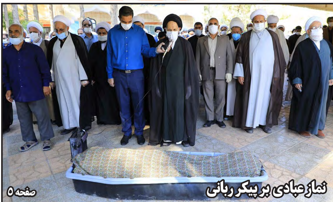
نماز عبادی بر پیکر ربانی

۷ افزایش سرویس‌های آبرسانی سیار در استان