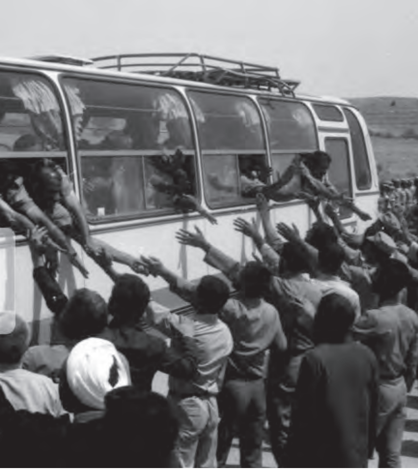
و نشاط بود و تعداد زیادی از مردم جزو خانواده های آزادگان نبودند اما این فضا بر روی تمام آحاد جامعه تأثیر مثبت خود را گذاشته بود. و امروز آزادگان آسوه ای استقامت و یادگاران شهدای

انگار همین دیروز بود با تنی خسته و رنجور اما گام هایی محکم و استوار پا به خاک میهن که نه پا به قلب ملت گذاشتند، آنهایی که صبر، شجاعت و استقامت را با خود به همراه آوردند و ثابت کردند برای دفاع از آب و خاک و ناموس باید تا پای جان پیش رفت.