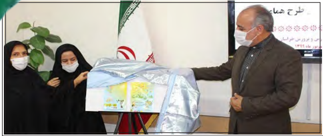
تولید ۴۰۰ اثر در حوزه سلامت توسط فرهنگیان استان