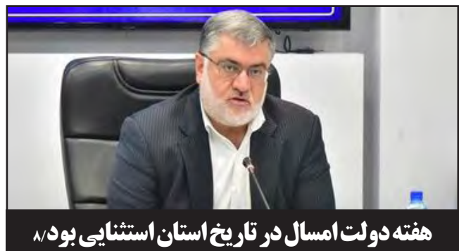
هفته دولت امسال در تاریخ استان استثنایی بود

شهردار بیرجند: اگر درآمد کمیسیون ماده ۱۰۰ نباشد حتی نمی توانیم زباله ها را جمع کنیم