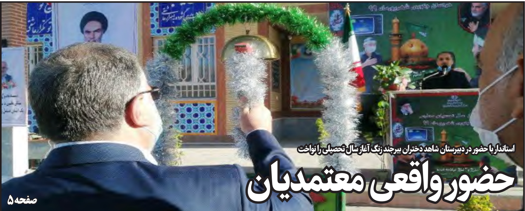
استاندار با حضور در دبیرستان شاهد دختران بیرجند زنگ آغاز سال تحصیلی را نواخت