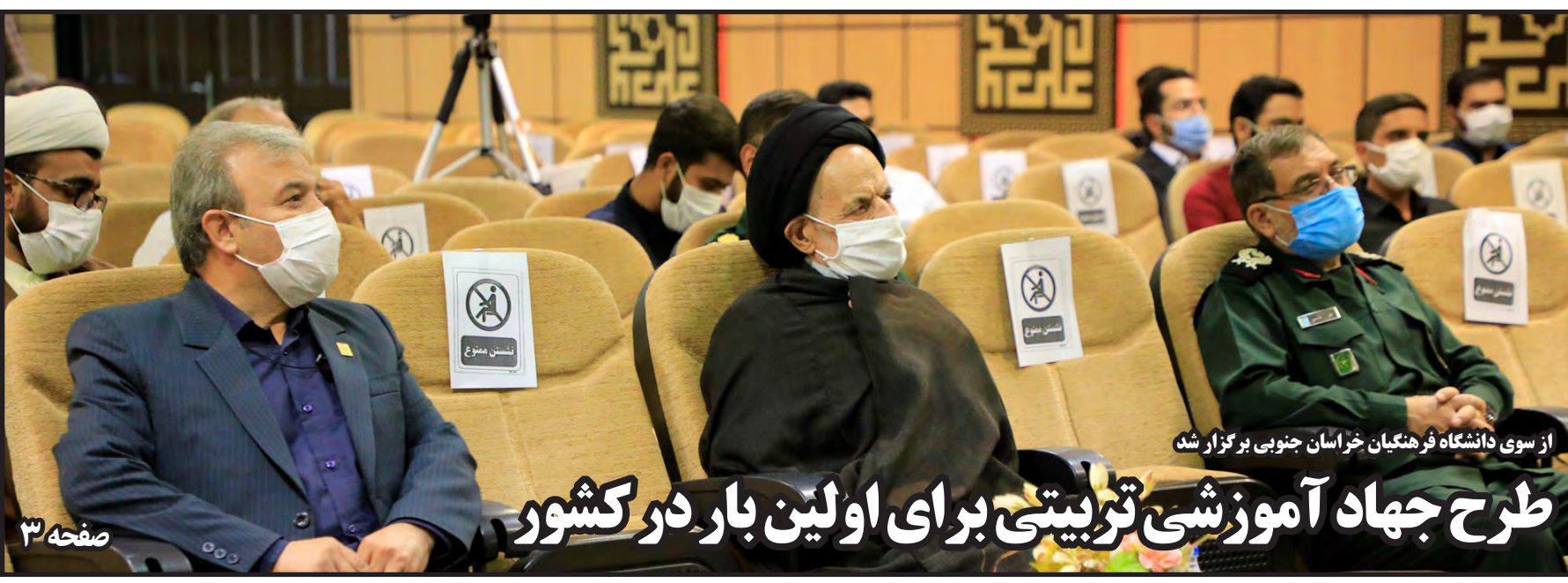
از سوی دانشگاه فرهنگیان خراسان جنوبی برگزار شد