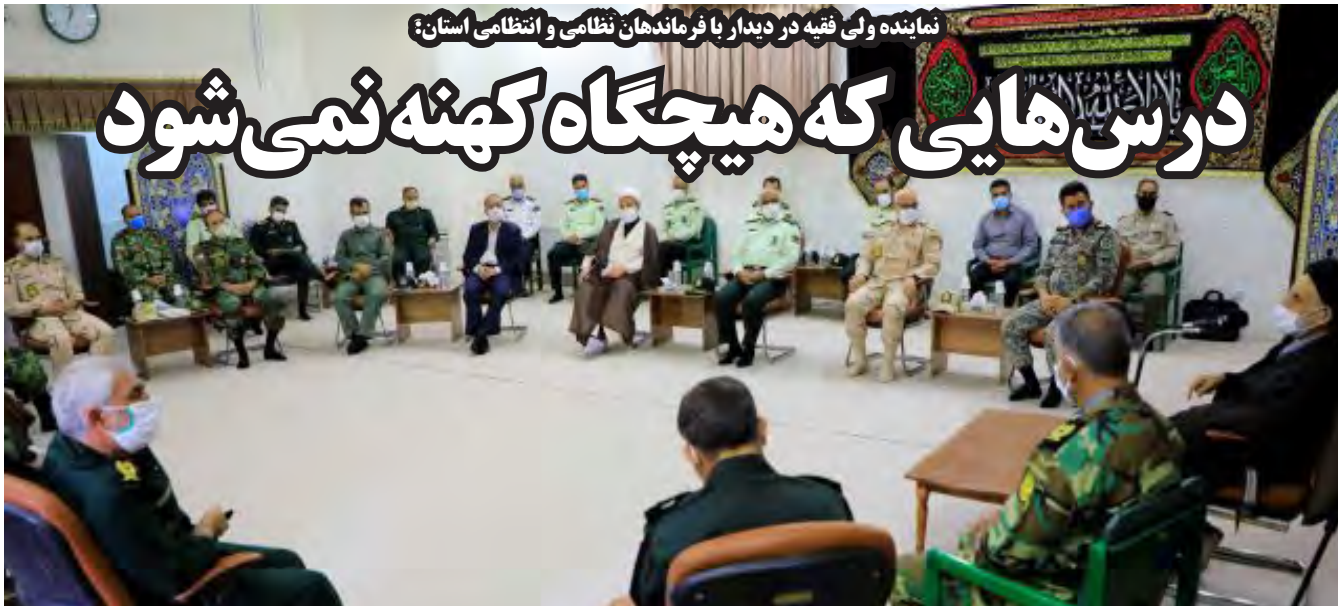
نماینده ولی فقیه در دیدار با فرماندهان نظامی و انتظامی استان

دغدغه های مردم ما به حداقل ها سقوط کرده ، دغدغه آنها دیگر سفر به اروپا و خرید خانه های لوکس و خودروهای لاکچری و دانشگاه و... نیست چگونه نماینده ای که دنا پلاس ۳۰۰ میلیونی با قیمت کارخانه و کسر ۸ میلیونی از حقوقش را قبول کرده می تواند از حقوق مردم و مولاناش دفاع کند و با غول های خودروسازان داخلی سرشاخ شود و ... وضعیت اقتصادی و کنش های اجتماعی از آنچنان پیچیدگی هایی برخوردار است که برای شناخت آنها می بایست مثنوی هفتاد من کاغذ نوشت ، به جرات می توان مدعی شد که مجموعه شعارهای مدیران خرد و کلان کشور حتی خودشان را هم می آزارد چه رسد به مردمی که دهها میلیون نفرشان زیر خط فقرند و فقط صبح تا شب می دوند که بتوانند زنده بمانند نه اینکه زندگی کنند...!! دنا پلاس بهانه ای است تا به اعوجاجات و کژی های موجود بیشتر واقف شویم تا بفهمیم برخی سیاست بازان مردم نما چند مرده حلاج اند و چگونه و با اینز ۳۰۰ میلیونی ماهی ۸ میلیون تومان قرار است کشور را گل و بلبل کنند