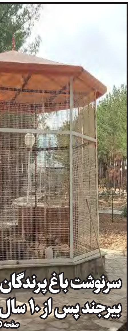
سرنوشت باغ پرندگان بیرجند پس از ۱۰ سال