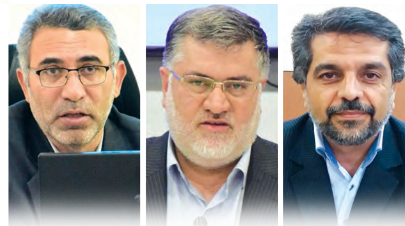
رایزنی استاندار و دو معاونش در پایتخت

دیروز برای خراسان جنوبی «روز خاصی» بود. سه تن از مسئولان استانداری در پایتخت حضور داشتند و هر یک در دیدارهایی با مسئولان کشوری برای تخصیص اعتبار، پیگیری و حل و فصل مشکلات استان چانه زنی کردند. به گزارش امروز خراسان جنوبی معتمدین که راه و چاه دریافت بودجه از مسئولان کشوری را به درستی آموخته و تاکنون در این زمینه موفق عمل کرده است و شاهد مثال آن تخصیص بودجه های بسیار خوب به استان در سال گذشته است؛ اکنون خم و چم این کار را هم به معاونان خود آموخته است که چگونه باید برای رفع مشکلات و دریافت بودجه، پای مدیران عالی رتبه و تصمیم گیر کشور را به استان باز کنند. دیروز استاندار خراسان جنوبی با اردکانیان وزیر نیرو و رئیس کمیسیون مشترک همکاری های اقتصادی ایران و افغانستان خواسته است برای توسعه روابط اقتصادی با این کشور بیش از پیش برنامه ریزی کند. همچنین معتمدین استاندار و عابدی معاون هماهنگی امور اقتصادی استانداری نیز با وزیر جهاد کشاورزی دیدار و از وی خواسته اند تا با سفر به خراسان جنوبی پروژه های روز ملی روستا را از این مشکلات و دریافت بودجه، پای مدیران عالی رتبه و تصمیم گیر کشور را به استان باز کنند. معاون هماهنگی امور اقتصادی استانداری خراسان جنوبی از سفر دو روزه، افتتاح پروژه آبرسانی به محلات عشایری بمرد به نمایندگی از پروژه های وزارت جهاد کشاورزی در سطح کشور، با حضور ویدئو کنفرانسی رئیس جمهور خواهد بود. به گفته وی این پروژه ها به صورت متمرکز و در راستای برنامه های گرامی داشت روز ملی