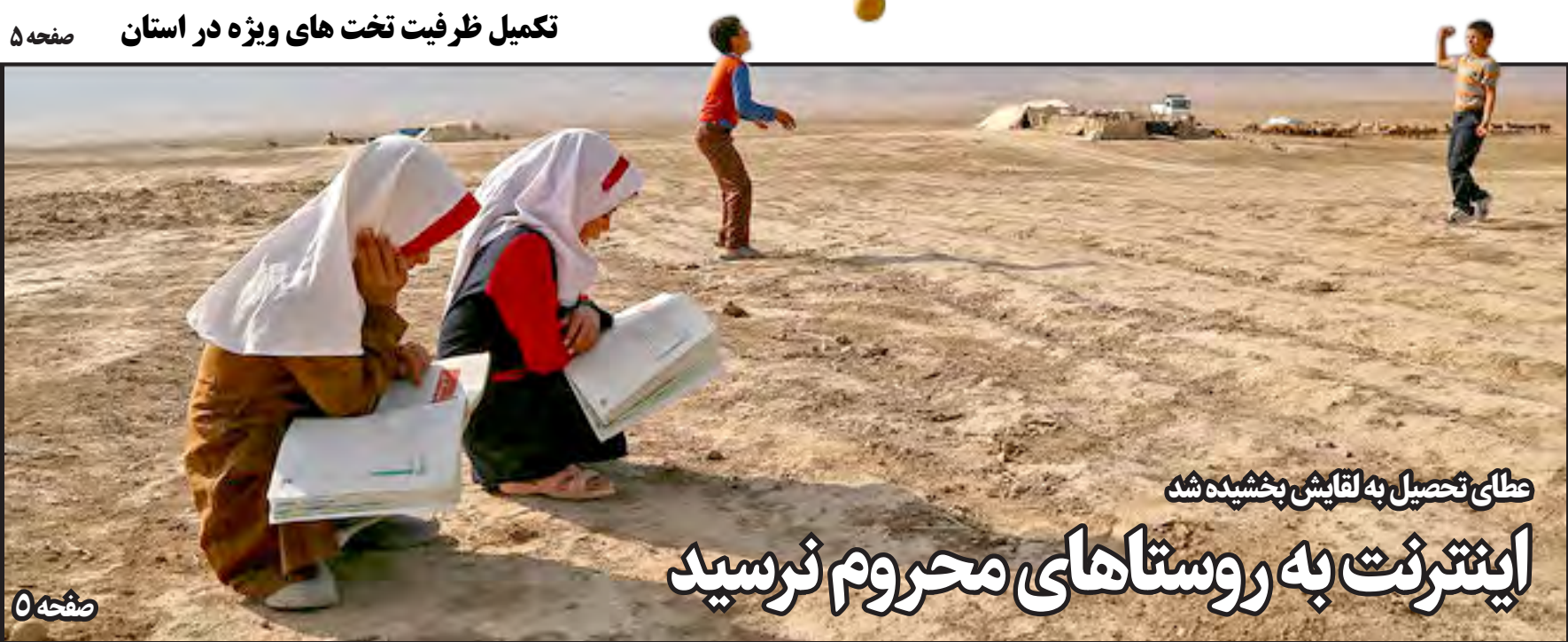
عطای تحصیل به لقایش بخشیده شد