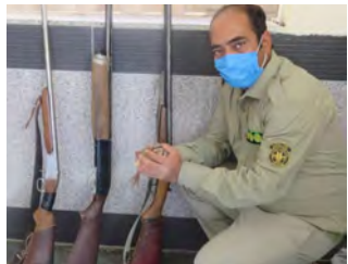
بازداشت متخلفان شکار غیر مجاز پرنده در خوسف

بازداشت متخلفان شکار غیر مجاز پرنده در خوسف لاشه ۶ قطعه انواع پرنده‌ها وحشی از متخلفان شکار و صید در شهرستان خوسف کشف و ضبط شد. رئیس نمایندگی حفاظت محیط زیست شهرستان خوسف گفت: بر اساس تفاهدمستگیری متخلفان شکار غیر مجاز پرنده در شهرستان خوسف نامه منعقد شده با پاسگاه‌های انتظامی حوزه شهرستان خوسف در خصوص همکاری برای حفاظت