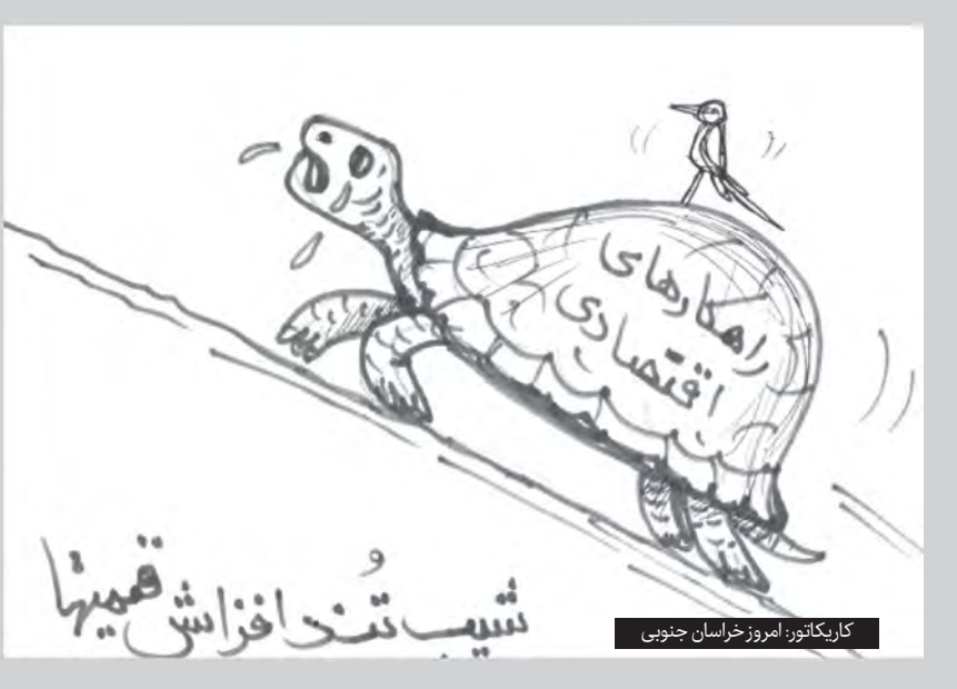
کاریکاتور: امروز خراسان جنوبی