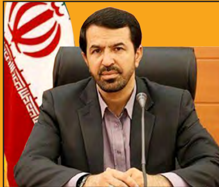
استاندار خراسان جنوبی: