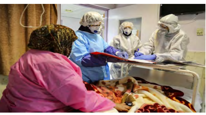
استفاده نکردن از ماسک و سایر عوامل شاهد افزایش سه برابری مبتلایان و ۱۱ مورد رییس شبکه بهداشت و درمان سرایان