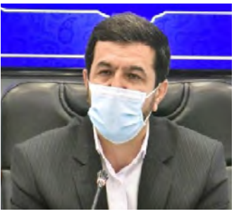
امروز خراسان جنوبی/ یآوری

تا به مواد اولیه خالص برای بانلنگی و پیشرفت دست نایبیم تمام طرح های مان چه در بعد سیاسی و یا اقتصادی و فرهنگی ایتر و ناکارآمد باقی خواهند ماند، مواد اولیه ای که در درون معادن منطق و عقل مان ذخیره شده اما هنوز استخراج کافی نگردیده است، مواد اولیه ای چون صداقت، آزادی در بیان و نوشتار، چرخش آزاد اطلاعات و شفافیت در تمامی امور اقتصادی و اداری و سیاسی و فرهنگی کشور و عدالت اجتماعی و...!!!