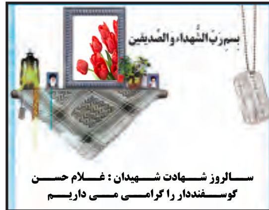
سالروز شهادت شهیدان: غلام حسن کوسفنددار را گرامی می داریم