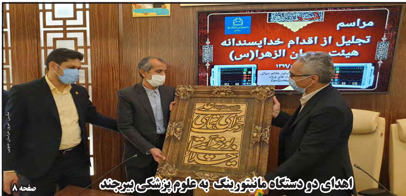
اهدای دو دستگاه مانیتورینگ به علوم پزشکی بیرجند

تو که مهربانی را گسترده می‌خواستی و انسانیت را ستایش می‌کردی. هیچ کس چون تو سرود زیبایی یاری رساندن بر قلله‌های فتح عشق را بی هیچ ادعا و بی هیچ چشم‌داشتی فریاد نمی‌کرد. و آنگاه که باید یاری می‌شدی، هیچ کس را یاری یاری رساندن به تو نبود.